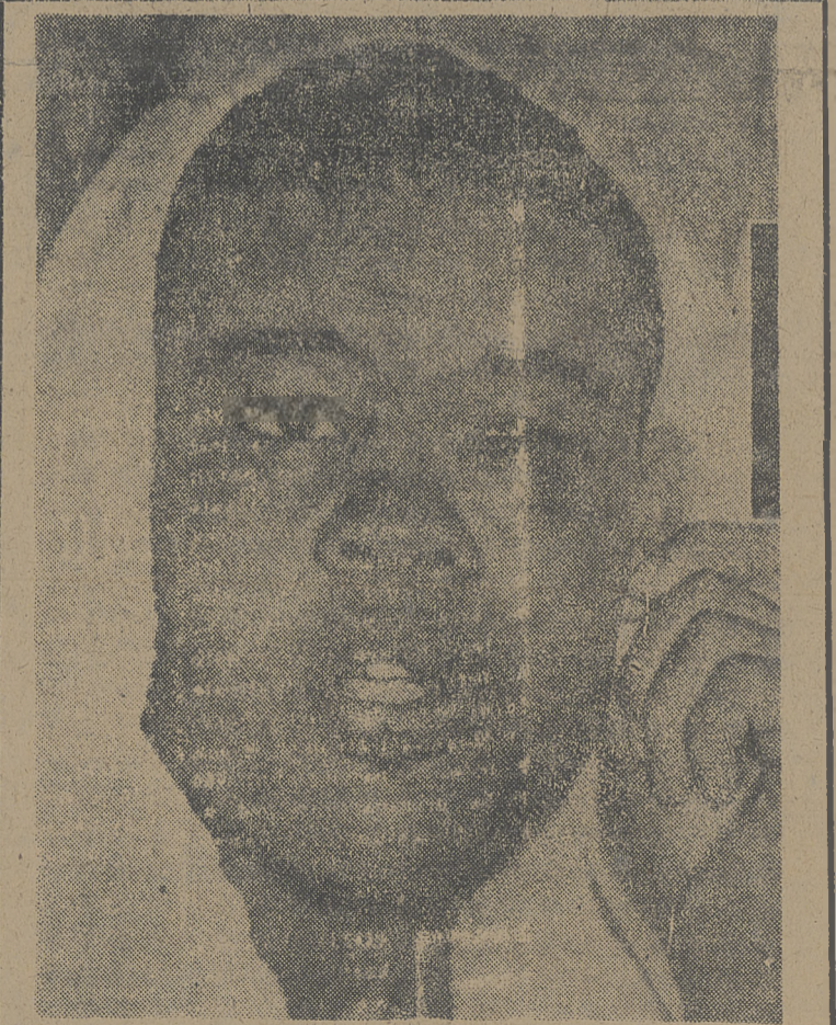
Joe Louis po walce z Walcottem. Podbite oko i rozbite wargi świadczą najlepiej o tym, że tym razem miał on ciężką przeprawę.

trzymaj Czytelnika w napięciu od pierwszej do ostatniej chwili. JUŻ W NASTĘPNYM NUMERZE „SPORTU”