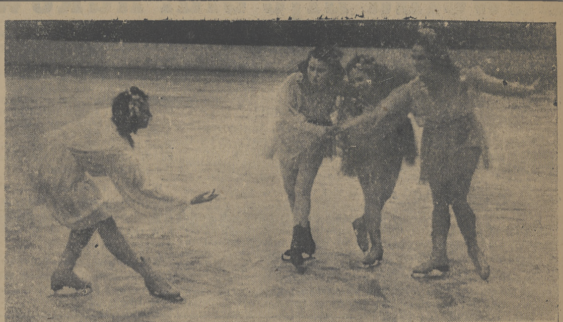
„Gdyby ciocia miała wąsy...“ wtedy Torkat mógłby być na kółkach. A gdyby Torkat był na kółkach, wtedy nimfy ze śpiewem „...nie straszny nam odwilży czas...“ odwiedziłyby kolejno wszystkie większe polskie miasta...