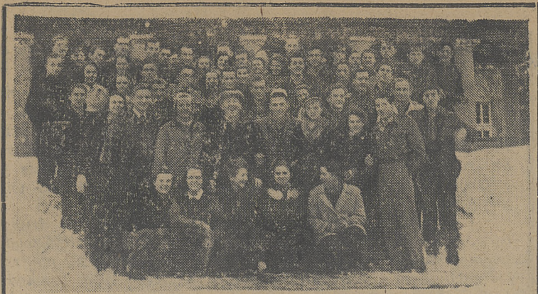
Grupa lekkoatletów i lekkoatletek przebywających na obozie PZLA w Krynicy.

PONIEDZIAŁEK ADRES REDAKCJI KATOWICE Rynek 6 II a. Telefon nr 334-03104