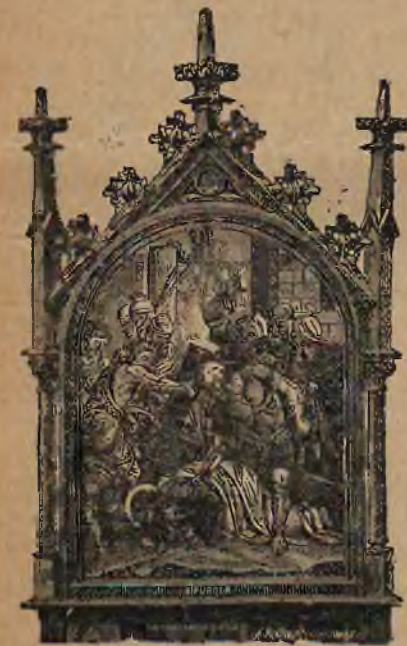
Rzeźbione w drzewie, w bogatej malaturze.