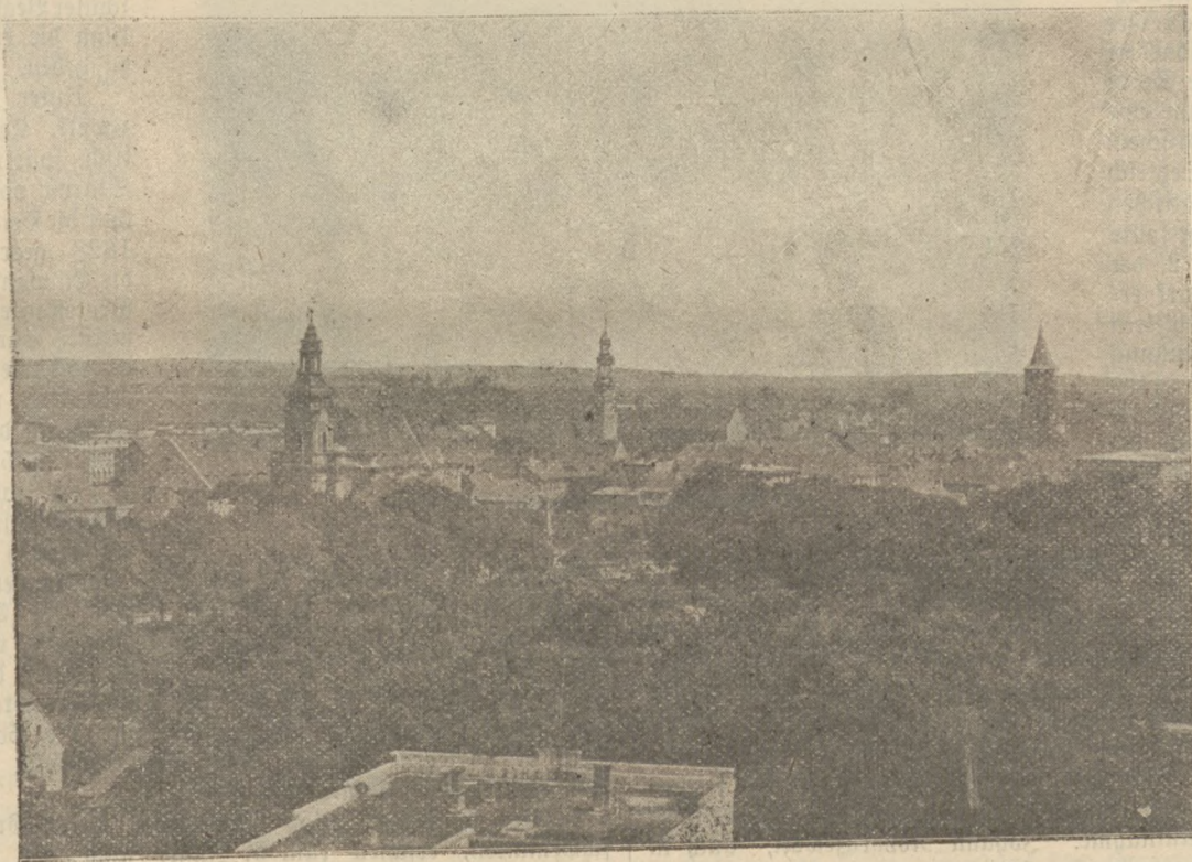
Ansicht von Krotoschin.

Den Einwohnern der so gegründeten Stadt schenkte er Felder und Wälder, Weiden und Wiesen mit dem Rechte der Jagd, des Vogelfangs und der Fischerei. Dafür hatten die