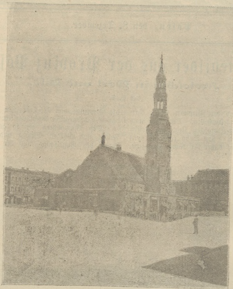
Rathhaus in Krotoschin.

Nach dem Abzuge der Schweden erhob sich die Stadt Krotoschin allmählich wieder. Die Zahl der Einwohner, auch