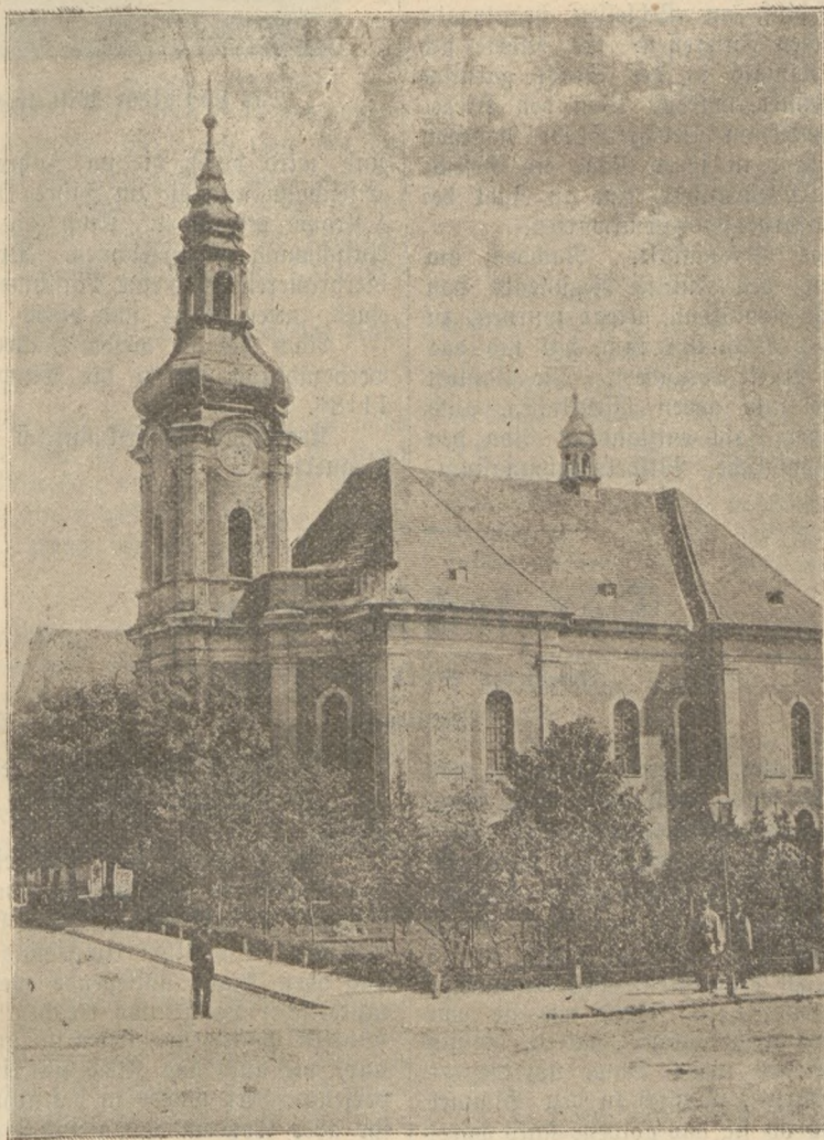
Trinitarier-Klosterkirche in Krotoschin.

Stufenweise erfolgte nun die Lösung der bisherigen Verhältnisse zwischen der Stadtgemeinde und dem Grundherrn be-