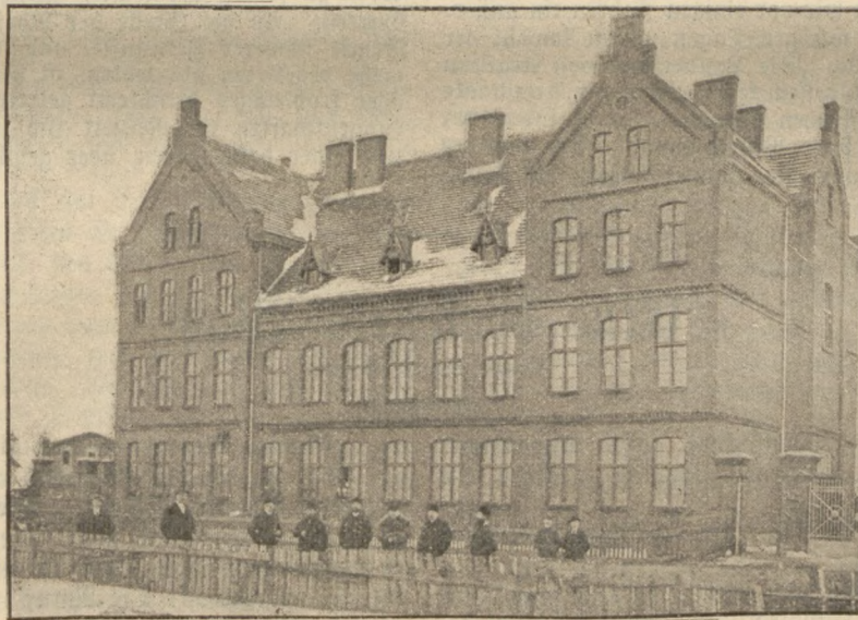
Simultanschule in Argenau.

Kirche, eine Synagoge, ein zwölfklassiges Simultanschulgebäude, in welchem auch eine Privatknaben- und eine höhere Töchterchule untergebracht ist, eine Apotheke, ein Postgebäude, eine Oberförsterei, eine Dampfziegelei, eine Delfabrik, eine Maschinenfabrik, ein großes Bau- und Holzgeschäft (von Fischer) und in nächster Nähe die große Zuckersabrik Wierchoslawitz. Das älteste Gebäude der Stadt (die übrigen sind sämtlich neueren Datums) ist die in gothischem Stil erbaute katholische Kirche — nach den an ihr befindlichen sogenannten Nüpfsteinen und dem eigenthümlichen Sims unter dem Dache zu schließen, wahrscheinlich gleichzeitig mit den katho-