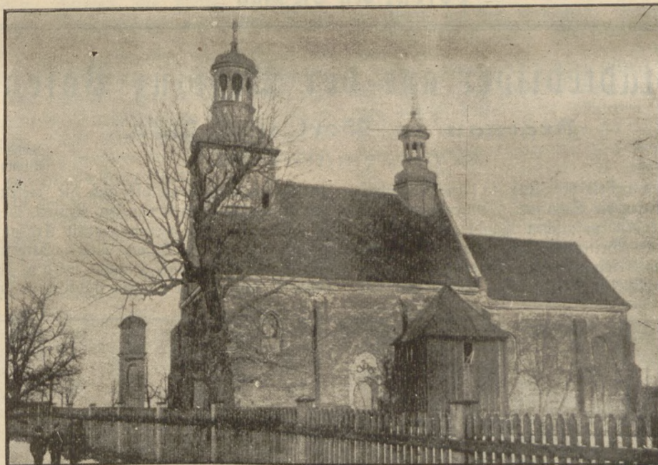
Alte katholische Kirche in Argenau.

Im Jahre 1788 zählte Gnievowo 75 schlechte, mit Stroh gedeckte und aus Holz erbaute Häuser mit einer katholischen Kirche und 500 Einwohner; 1816 : 78 Häuser und 600 Einwohner; 1837 : 952, 1843 : 1225, 1858 : 1381, 1861 : 1387, 1867 : 1593 Einwohner, und zwar 424 Evangelische, 1009 Katholiken und 160 Juden. Nach der Volkszählung vom 1. Dezember 1875 hatte Gnievowo (seit 1878 in Argenau umgetauft) 160 Wohnhäuser, 401 Haushaltungen und 880 männliche und 960 weibliche, zusammen 1840 Einwohner, bei der Volkszählung vom 1. Dezember 1895 : 200 Wohnhäuser, 1200 evangelsche, 1400 katholische, 100 jüdische, zusammen 2700 Einwohner. Nach obiger Statistik hat also Argenau, seit es unter preussischer Herrschaft steht, um nicht weniger als 2200 Einwohner zugenommen. Alle die fürsorglichen Maßregeln, die Preußens Regenten unter Daransetzung außergewöhnlicher Mittel anwendeten, um die neu erworbenen in jeder Beziehung vernachlässigten polnischen Landestheile zu heben, kamen auch der ehemaligen Residenz Kujawiens zu Gute und machten aus derselben schließlich das heutige blühende Landstädtchen Argenau. Freilich blieb es