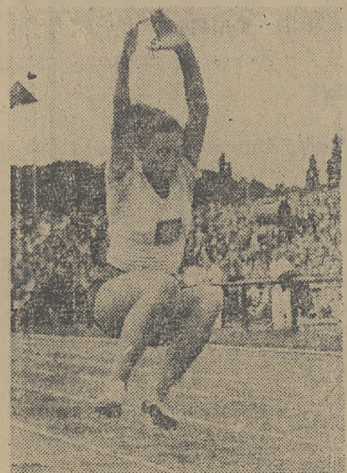
GBURKOWNA podczas swego występu na pierwszych lekkoatletycznych zawodach o mistrzostwo NRD w Halberstadt.

Występy tenisistów radzieckich oczekiwane są w stolicy z wielkim zainteresowaniem.