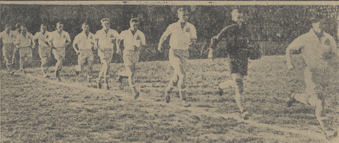
UNIA RUCH CHORZÓW wystartowała do rundy jesiennej w doskonałej formie. Świadczy o tym zwycięstwo nad Kolejarzem Warszawa 4:1 (3:0).

Druga reprezentacja CRZZ wyjeżdża na zaproszenie TUL do Finlandii na okres 16 - 24 sierpnia br. w następującym składzie: Sobkowiak, Słoma i Aniola z Kolejarza Poznań, Brzozowski, Łącz i Szczepański z Kolejarza Warszawa, Janik, Barański z Budowlanych Chorzów, Rajtar z Ogniwa Kraków, Narloch i Trampisz z Ogniwa Bytom, Stefanyszyn ze Związkowca Kraków, Opitz ze Związkowca Poznań oraz Włodarczyk z Włókniarza Łódź.