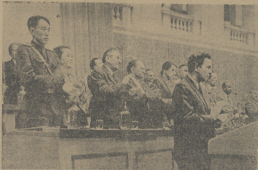
Prezydium I Kongresu Pokoju

Plątek 1 września 1950 roku. Nad Warszawą świeci słońce, wieje chłodny wiatr, rozwiewa flagi nad bramami domów. Przed gmachem Politechniki Warszawskiej wyrósł las masztów i wież. Mienia się na nich wszystkimi kolorami tęczy sztandary państw, których narody walczą o pokój.