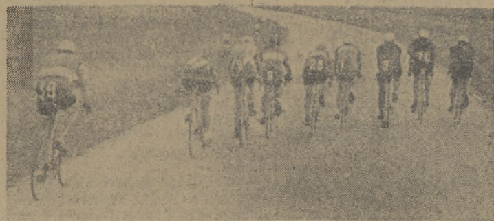
Równa jak stół szosa prowadzi do Opola. Szerokim „wachlarzykiem“ pedałują kolarze, bacznie uważając, by ktoś nie urwał się z zgodnie jadącej grupy.

Cyfrы naszej produkcji skaczą już aż do gwiazd Skaczymy wszcz, sięgamy w głąb, do naszych zdrowych mas.