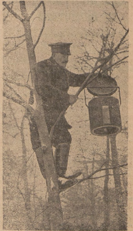
В берлінських звіринцях уладжено багато автоматичних скриньок для прокорму птиць. В кожній вмщається 15 фунтів зерна.

цузьких газетах заяву, в якій ви-ясняє на що він зужив ці гроші. Він твердить, що суму 15 тисяч доларів видав він згідно з припо-рученням московського уряду на ведення комуністичної пропаганди та шпигунської акції у Франції.