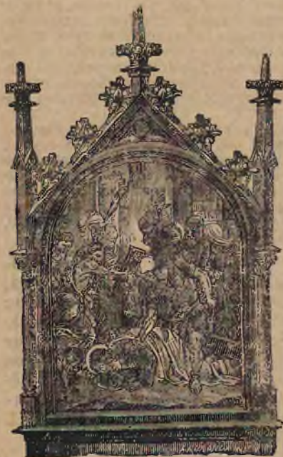
Rzeźbione w drzewie , w bogatej malaturze.