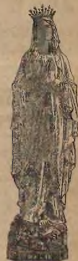
We wielkości 58, 65, 80 cmtr.

Kolekaya żłóbkowa , powleczone najpiękniejszą strzyżką sukienną, obejmują następujące figury: Dzieciątko Jezus, Pannę Maryję i Józefa, Aniołów w górze, trzech do pięciu pasterzy, Trzech Króli, trzech służących jako też wołu i osiołka, wielbłąda, kilka owiec i jagniąt. Zwyczajną wielkość figur wynosi 30 do 65 cmtr. Cena od 150 do 300 fl. za cały żłóbek i wyżej, stósownie do wielkości i liczby figur i czy ze stajenką lub bez niej.