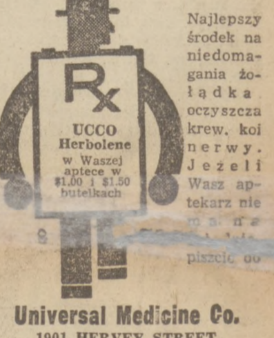
Najlepszy środek na niedomagania żołądka oczyszcza krew, koi nerwy. Jeżeli Wasz apetyt nie jest w porządku, kupcie...