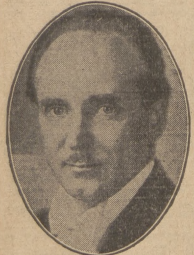
Profesor Jerzy Bojanowski