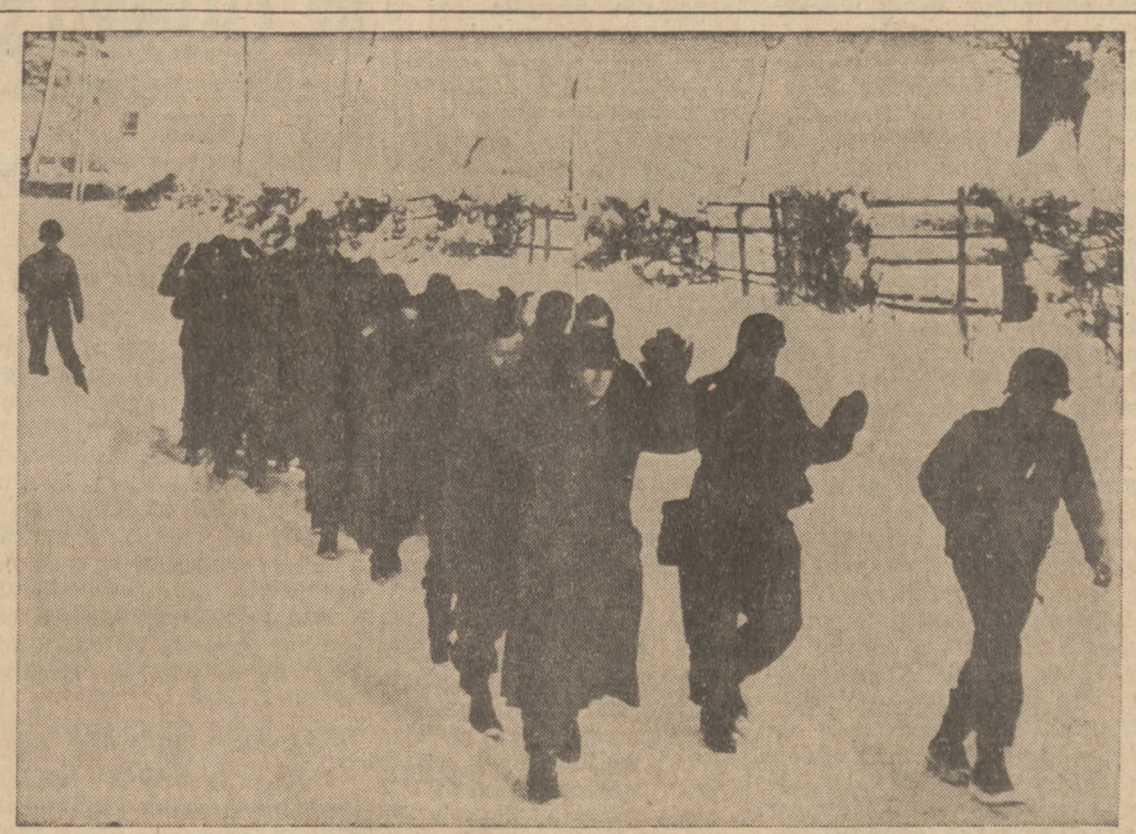
ARMIA AMERYKAŃSKA NA LINII ZYGFRYDA. — 1 i 3-cia amerykańska armia zajęły wieś Losheim w Niemczech i zdobyły nową broń na nieprzyjaciela.

1,200 BOMBOWCÓW W AKCJI Przeszło 1,200 ciężkich bombowców angielskiego R. A. F. wyroliło się ubiegłej nocy ponad zagłębienie Ruhry i Nadręnie celem poszukiwania alianckich armii lądowych. Lotnicy wykonali jednocześnie silne uderzenie w sieć niemieckiej komunikacji kolejowej poza frontem i w wytwórnię sztucznej gazoliny — w Karlsruhe, Wiesbaden i Wanne-Eickel. Najsilniejsze naloty były wykonane na centralne koleje w Karlsruhe i Wiesbaden na lewym brzegu Renu, gdzie znajdują się "żyłki" niemieckiej linii kolejowych w komunikacji między centralnymi węzłami. (Dokończenie na str. 2-cj)