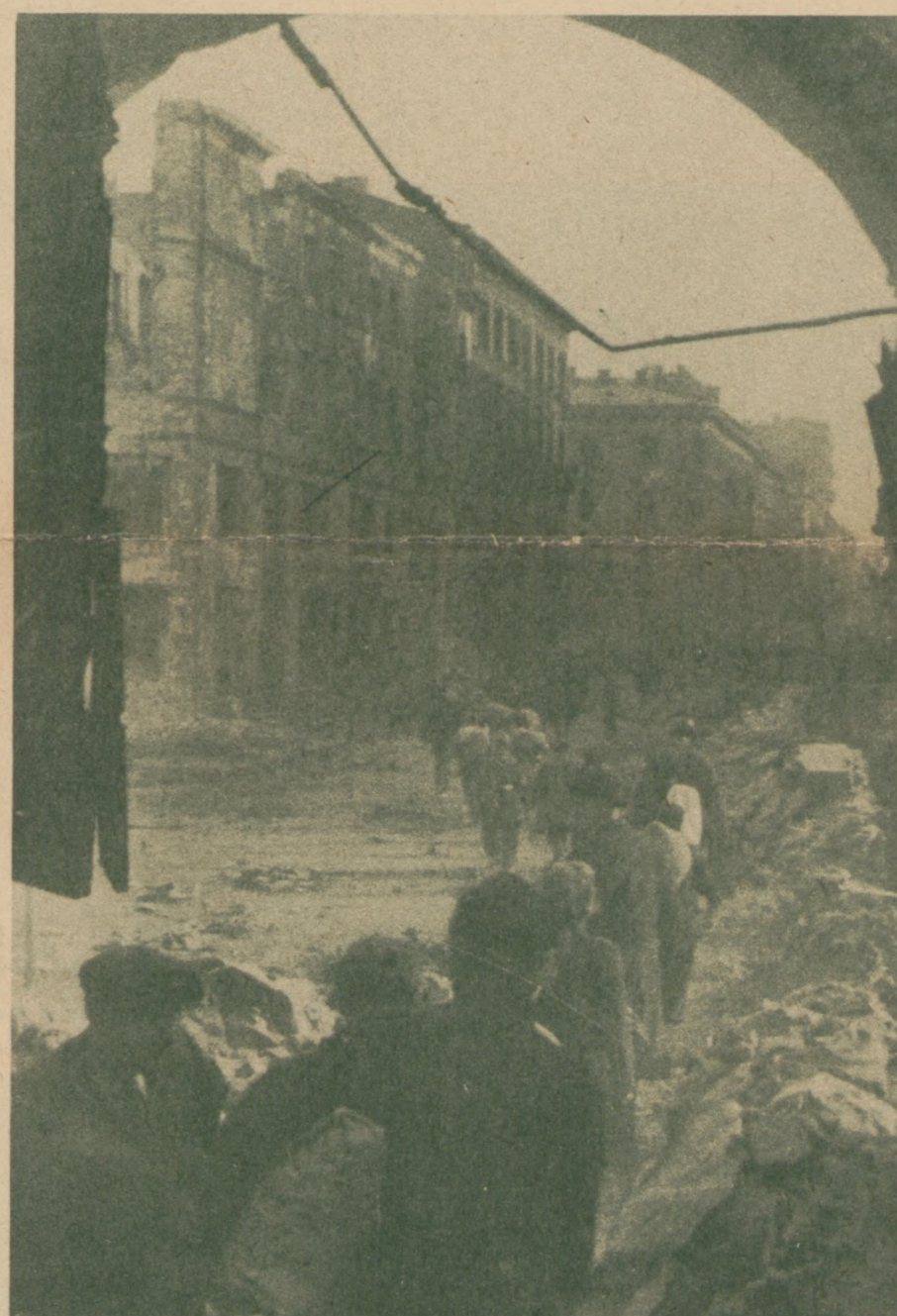
Na rozkaz władz niemieckich ludność opuszcza Warszawę po upadku powstania