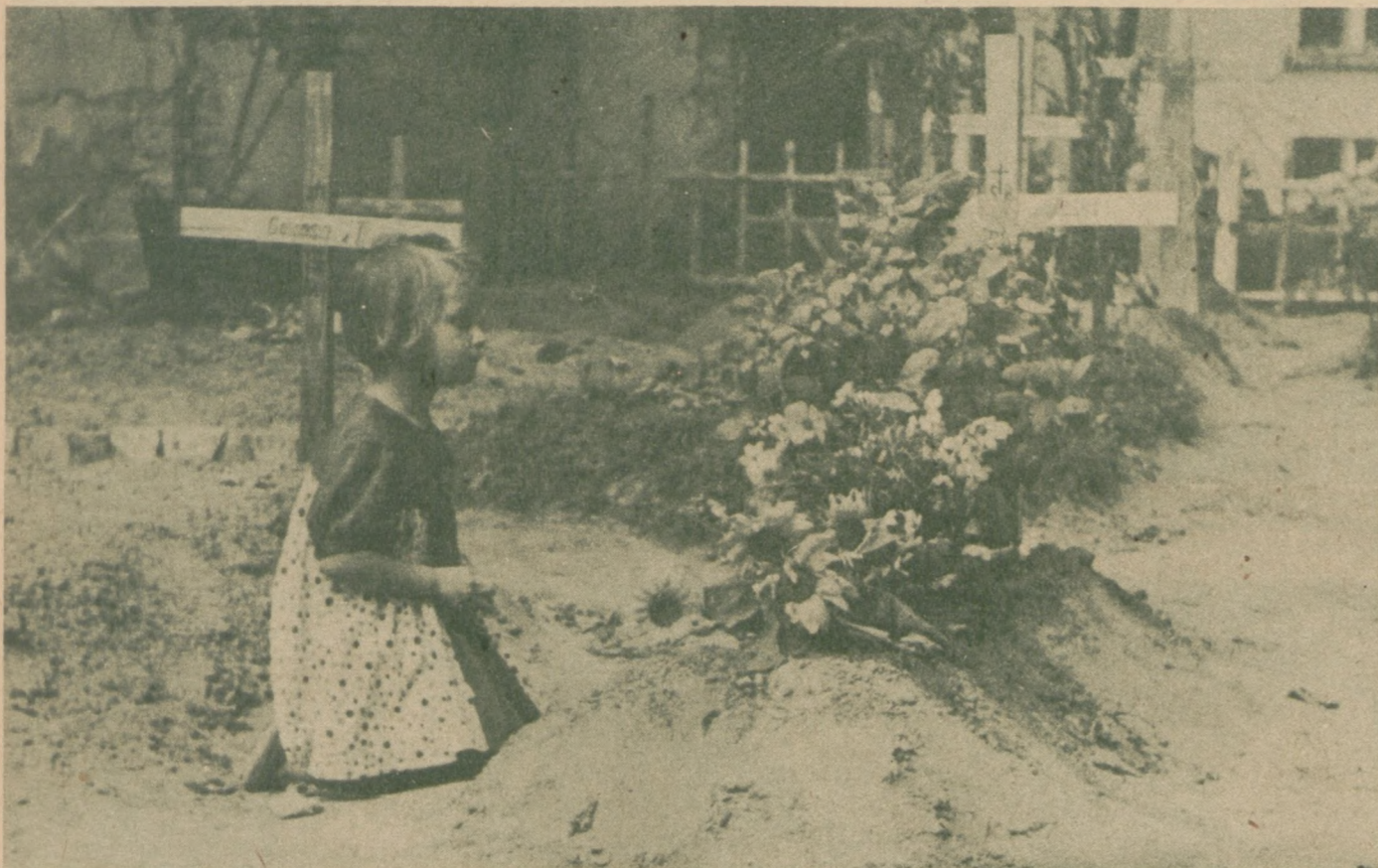
Na mogiłe matki zabitej podczas powstania

Z heroicznego okresu powstania warszawskiego podajemy dalszy ciąg zdjęć fotograficznych. Tak wyglądała Warszawa walcząca samotnie z okupantem niemieckim, palona i niszczone przez hitlerowców, wystawiona na rzeź przez szwieckich "sojuszników". Z dymem pożarów . . . minęły dni tej rozpaczliwej, nierównej, beznadziejnej walki. Ale pozostanie na zawsze pamięć tego bohaterstwa i pamięć ogromnej krzywdy zdradzonej przez aliantów i wydanej na łup Warszawy. "Skarga to straszna . . . od takiej skargi bieleje włos . . ."