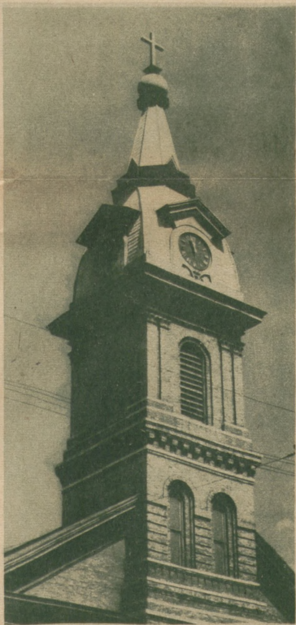
PIĘKNA WIERZYCA KOŚCIOŁA ŚW. JACKA uwidoczniła po stronie lewej. Po prawej, widzi-my wierzyce kościoła św. Stanisława.