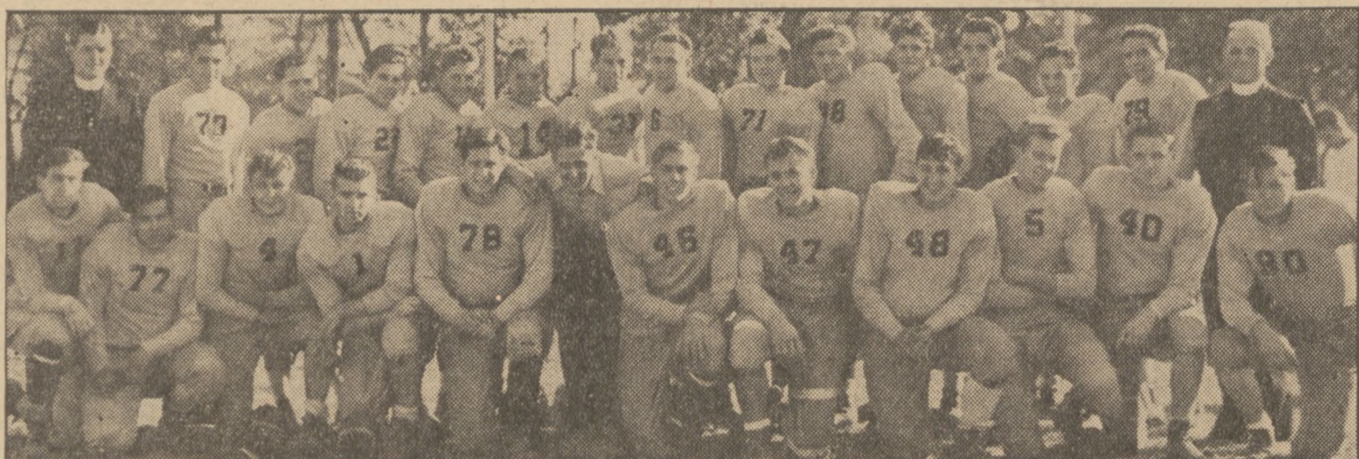
The St. Salomea football team recently defeated the State Ice Cream squad...