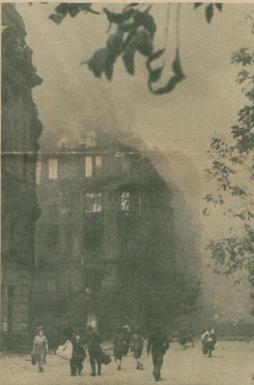
"Z dymem pożarów . . ."