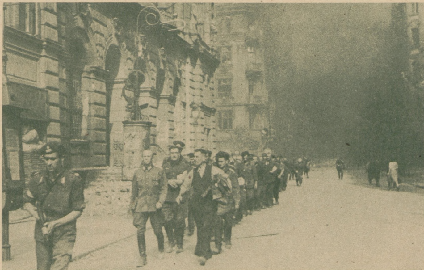
Jelcy niemieccy wzięci do niewoli przez powstańców