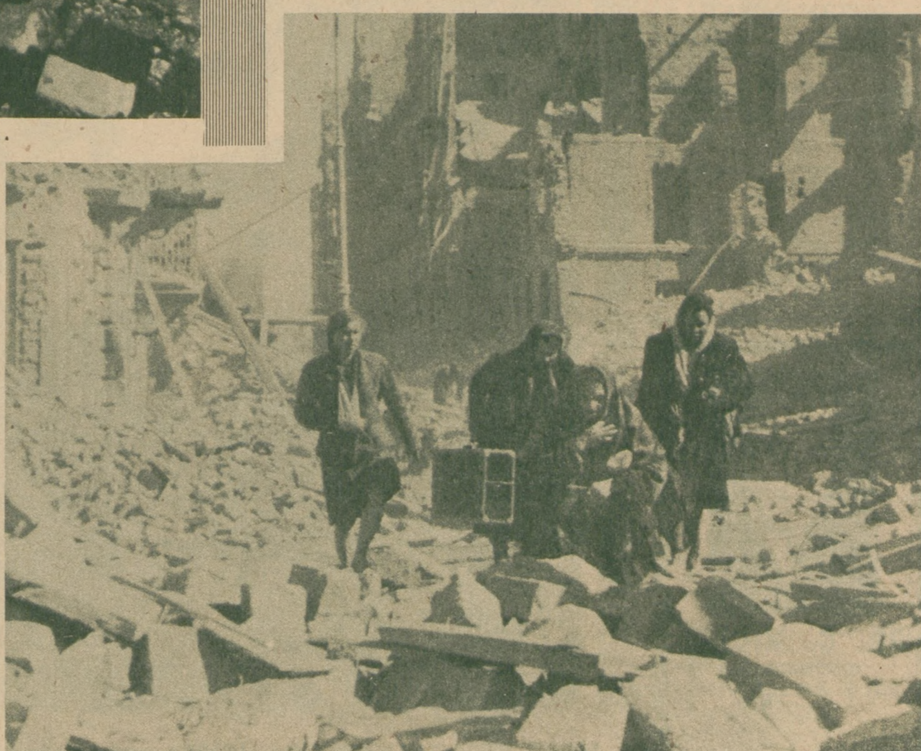
W drodze na tułaczkę