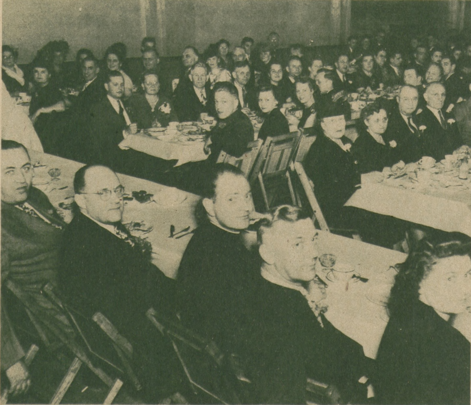
OGÓLNY WIDOK NA SALE PODCZAS BANKIETU, urządzonego przez Gminę 23-cią Z. N. P. dla weteranów 2-ej wojny światowej z grup przynależnych do gminy, dnia 27-go października. Przyjęcie odbyło się z Barney's Grill, 9231-33 Houston Ave., South Chicago.