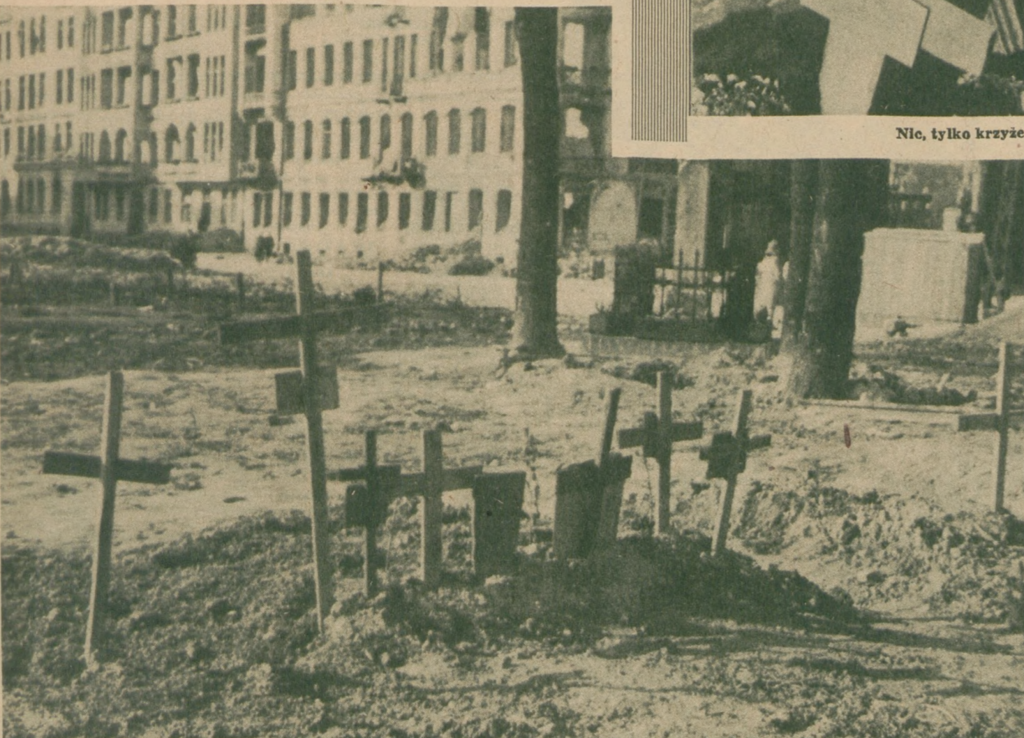
Mogily na ulicach Warszawy