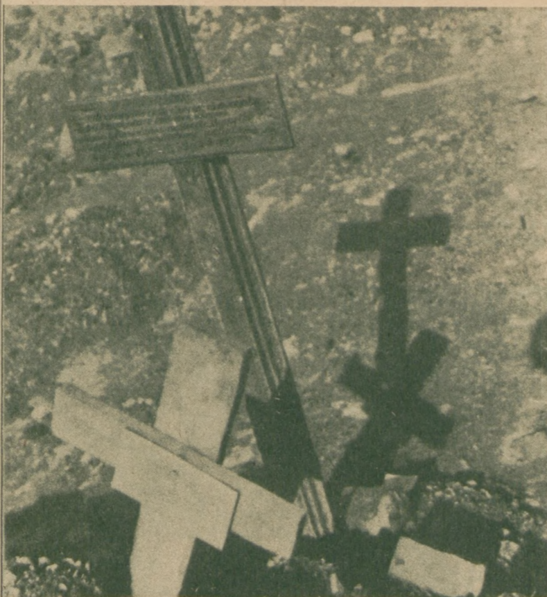
Nic, tylko krzyż . . .