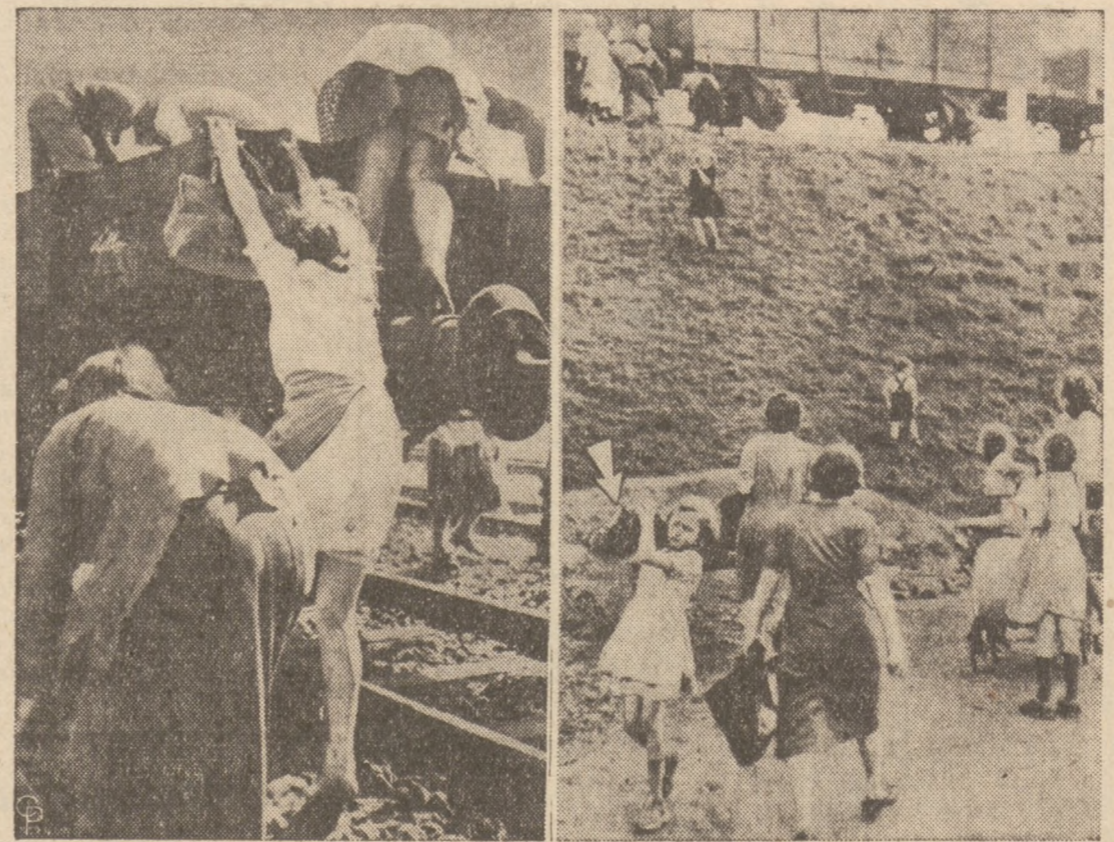
ŁUDNOŚĆ W EUROPIE RABUJE POCIĄGI Z WĘGLEM aby zdobyć beczenny materiał na opał. Strzałka wskazuje na dziewczynkę, której udało się "zdobyć" bryłkę, aby znieść ją do domu.