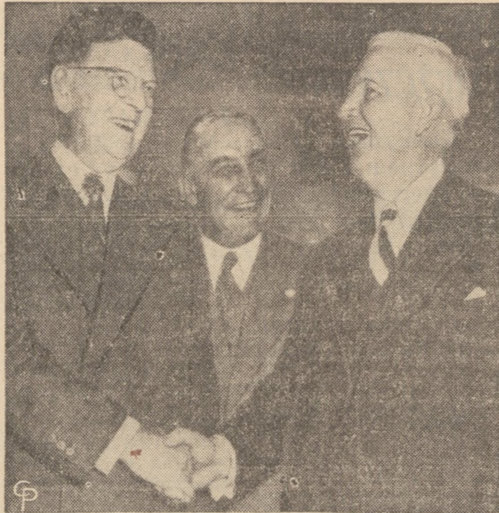
OBECNY MAYSIA CHICAGO EDWARD J. KELLY (po lewej) gratuluje zwycięstwa w wyborach nowowbranemu mayorowi miasta Martinowi H. Kennelly.