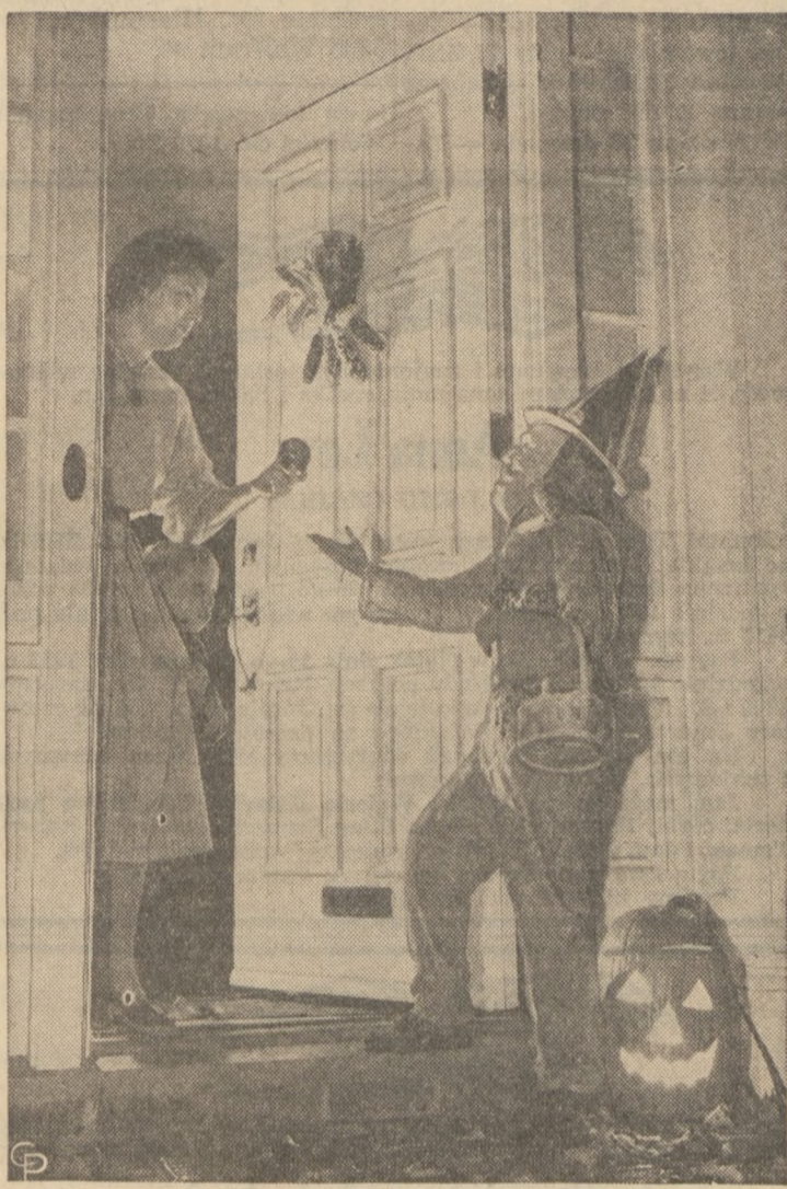
THE GOBINS will get you if you don't watch out, is the theme here as this mother surrenders to Halloween 'trick or treat' while her wide-eyed son peeks around her skirt in doorway.