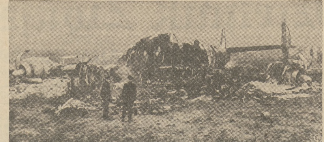
NA STRAZY WRAKU SAMOLOTU.—Dwóch policjantów pilnuje resztek samolotu Eastern Airlines, który rozbił się i zapalił na lotnisku International w Idlewild, N. Y. Z 27miu osób na pokładzie, dwoje zginęło, a reszta zdołała się uratować dzięki poświęceniu kasjera i stewardesy.