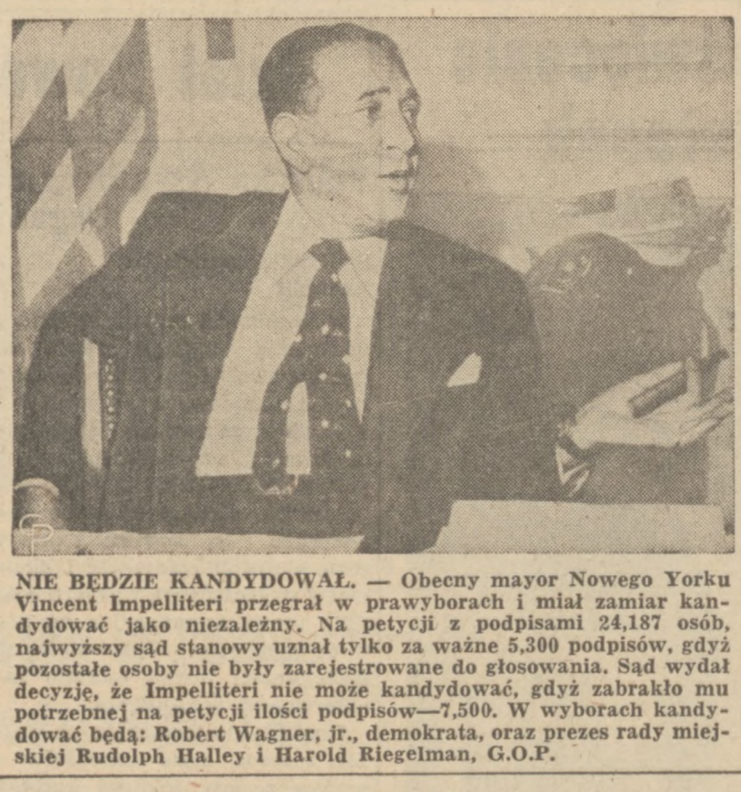
NIE BĘDZIE KANDYDOWAŁ. — Obecny mayor Nowego Yorku Vincent Impellitteri przegrał w prawyborach i miał zamiar kandydować jako niezależny. Na petycji z podpisanymi 24,187 osób, pozostałe osoby nie były zarejestrowane do głosowania. Sad wydał decyzję, że Impellitteri nie może kandydować, gdyż zabrakło mu potrzebnej na petycji ilości podpisów—7,500. W wyborach kandydować będą: Robert Wagner, jr., demokrat, oraz prezes rady miejskiej Rudolph Halley i Harold Riegelman, a G.O.P.

WIÓRA SPÓD PIÓRA Ostatnio dokonano dwóch wielkich odkryć w dziedzinie produkcji środków żywnościowych. Jednym z nich jest fabrykacja mleka syntetycznego, drugim zaś zastosowanie wodorostów jako pożywienia. Brytyjski instytut biologiczny zbudował aparat do przetwarzania węglowodanów na proteiny i witaminy, podobne do tych, które zawiera mleko. W najbliższym czasie aparat ten, zwany "sztuczną krową", zostanie zastosowany do produkcji fabrycznej na większą skalę. Z drugiej strony odkryto, że wodorosty "chlorella", niezwykle łatwe do hodowania, zawierają 50 procent proteiny. Do wyhodowania wodorostu potrzeba jedynie siłosa, dwutlenku węgla i azotu z powietrza, a zatem da się on hodować w krajach ciepłych jak Izrael, czy Indie, którym zawsze grozi kłeska głodu. Smak tych wodorostów przypomina smak dyni.