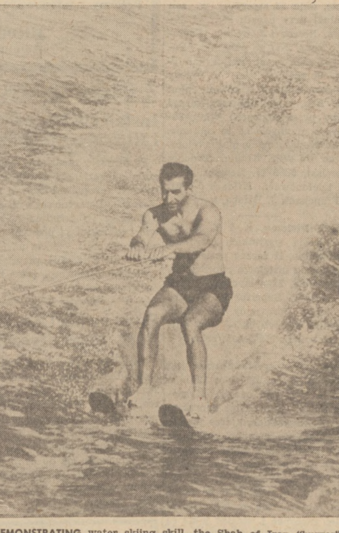
DEMONSTRATING water skiing skill, the Shah of Iran "buzzes" photographer's boat at Miami Beach, Fla.