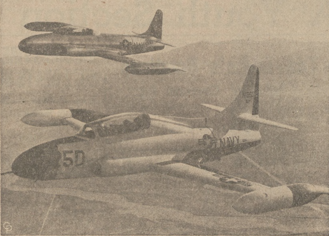
NOWY SAMOŁOT SZKOLNY. — W Kalifornii dokonano pierwszych prób z odrzutowym samolotem typu T2V przyznanym do szkolenia pilotów i załogi do operowania z lotniskowców. Samolot ten (na pierwszym planie) osiąga szybkość do 600 mil na godzinę, ma cały szereg urządzeń ułatwiających szkolenie.

Powstała nowa sytuacja, dla nas korzystna, nakładająca jednak obowiązek zachowania największego umiaru i trzeźwości, dodająca nam nie tylko otuchy i nowej wiary, ale nakazująca nam właśnie teraz ZDWOIĆ SIŁY I STARANIA.