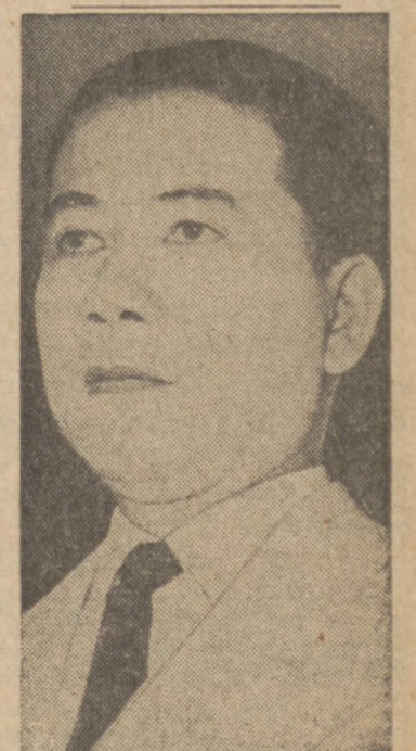
ŻĄDAJA REZYGNACJI. — Przywódca sekt religijnych w Północnym Wietnamie żądał ustąpienia premiera Ngo Dinh Diem (na zdjęciu), a powstały na tym tle spór doprowadził kraj do stanu wojny domowej. Oddział wojskowy przywódców religijnych obiegł stolicę Saigon.

Tokio. (UP) — Komunistyczne radio podało, że w katedrze rzymsko-katolickiej w Pekinie zebrało się w niedzielę wielkanocną około 3 tysiące katolików i wysłuchało mszy świętej.