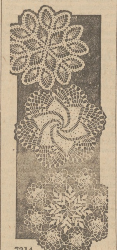
7214 by Alice Brooks Wzór 7214

Bardzo łatwe do wysydelkowania serwetki, które nadają się do różnego celu w domu. Wzór 7214 obejmuje dokładne wskazówki wysydelkowania 3 odmiennych serwetek: wielkości 8 i 8 1/2 cali z bawełny No. 50, a większych z grubszej bawełny. Cena wzoru 25 centów. Należy tość prosimy nadsyłać w srebrze lub w 3c znaczkach pocztowych (lecz nie airmail). Z Kanady gotówką.