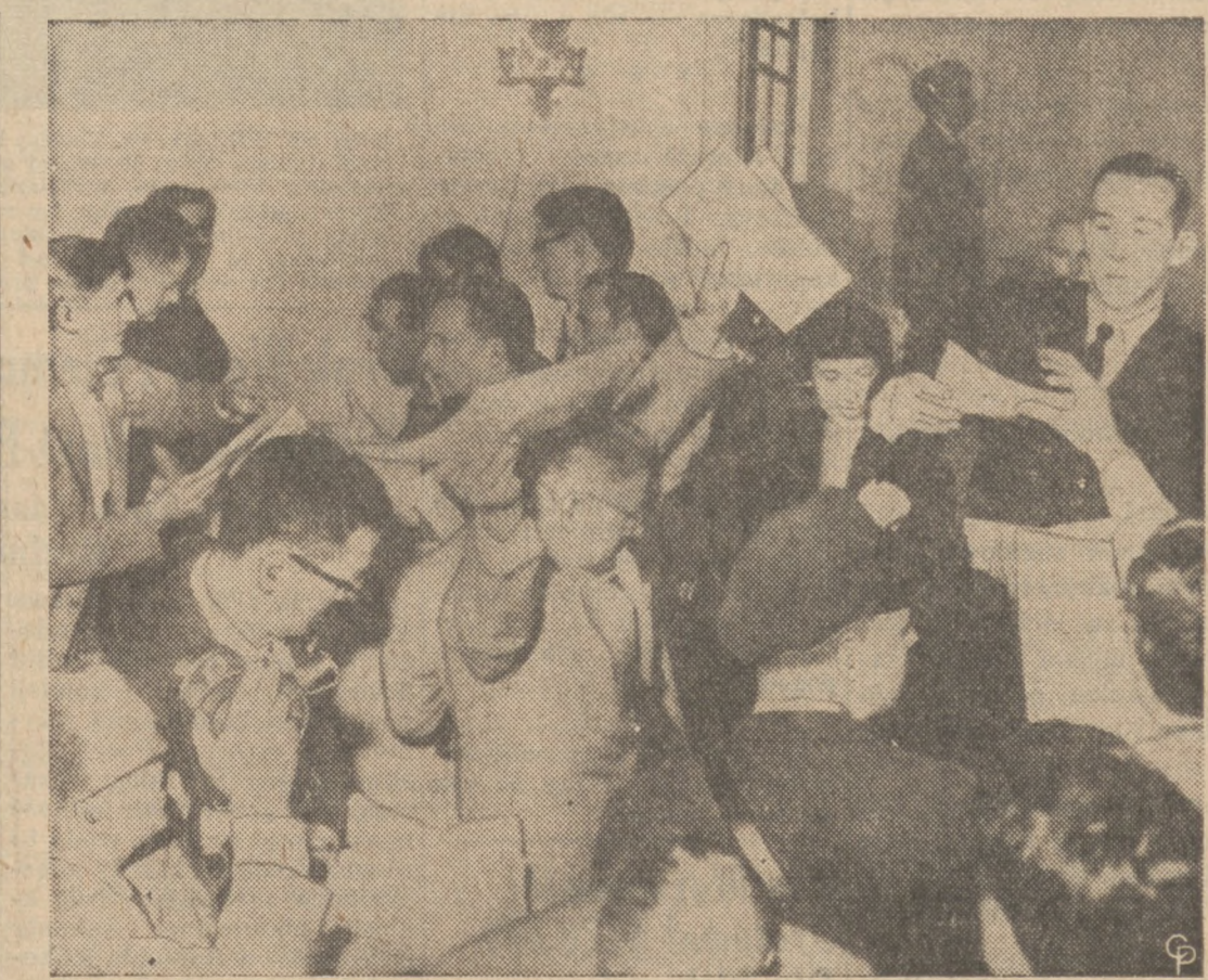
DZIENNIKARZE OTRZYMUJĄ RAPORT W SPRAWIE SZCZEPIONKI. Tłumy dziennikarzy oczekiwało razem z lekarzami na Uniwersytecie Michigan w Ann Arbor, Mich., na ogłoszenie specjalnego raportu o skuteczności szczepionki przeciwko polio, wynalezionej przez dr. Jonas Salka. Na zdjęciu dziennikarze wyciągają sobie kopie komunikatu prasowego. Raport stwierdził, że szczepionka ta jest skuteczna w 80 do 90 procentach, dr. Salk dodał, że została ona ulepszona od ostatniego roku, kiedy dokonano próbnego szczepień i obecnie daje ona prawie 100 procent gwarancji skuteczności.

San Juan, Porto Rico. (U.P.). — Przedstawiciele krakowskiej republiki łacińskiej produkujących kawę podpisali wczoraj rezolucję wzywającą do założenia natychmiast międzynarodowego biura dla "spraw kawy". Jednym z głównych celów tego biura będzie ustanawianie cen kawy.