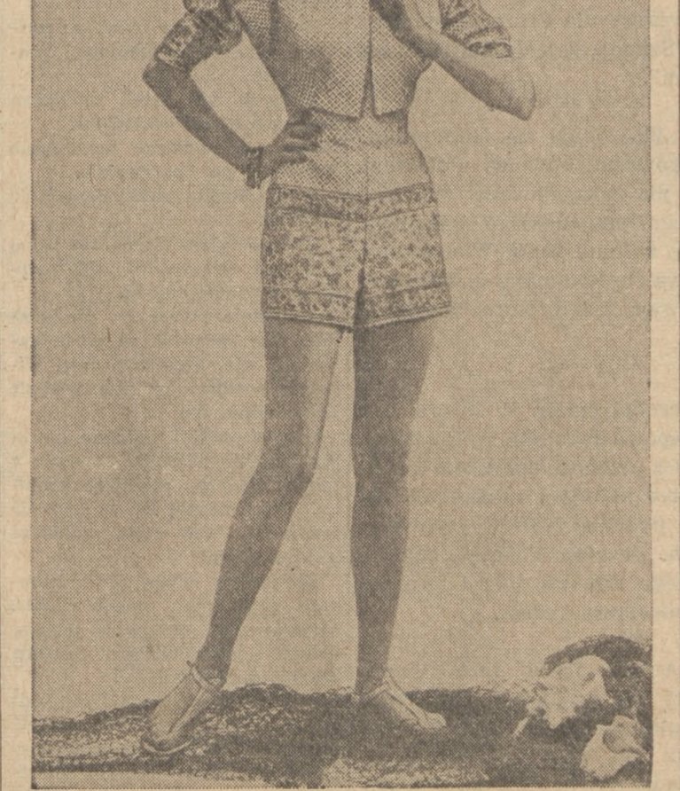
Ubranko sportowe stylu "matador" z bawełny. Do ubranka noszone jest zaklepek bolero z tego samego materiału.

Bilety nabywać można w restauracjach: Lenard i Baranowski oraz w dniu przedstawienia przy kasie od godziny 6-tej wiecz.