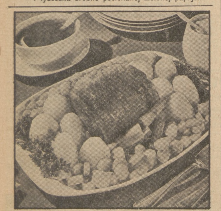
Pieczonka podana z gotowanymi jarzynkami, stanowi smaczne danie na obiad.