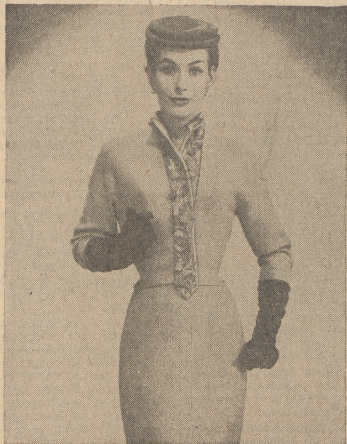
Ręcznie heklowana sukienka, które to suknie cieszą się wielkim wzięciem wśród wytwornych pań.

Uлюбioną rozrywką Pierwszej Damy jest pisanie listów do syna i przebywanie z wnucami. Pani Mamie Eisenhower do obojga włościła srebrną szkatułkę do biżuterii w kształcie serca, podarek od męża w pierwszą rocznicę ślubu, złotą bransoletę (charm bracelet) od przyjaciółki, maskę gazową, amerykański sztandar, kule do