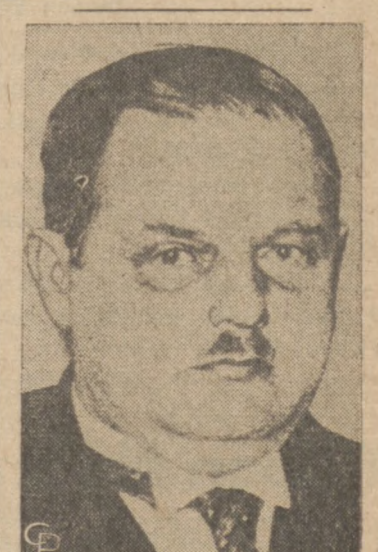
KONFERENCJA W MOSKWIE — Kanclerz Austrii Julius Raab odbywa obecnie w Moskwie konferencję z rządem sowieckim w sprawie podpisania traktatu pokojowego pomiędzy tymi dwoma państwami. Traktat ten zakończył ma stan wojenny istniejący od wybuchu 2giej Wojny Światowej.

W Washingtonie, departament stanu oświadczył, że "postawa Rosji co do rokowań w sprawie pokoju z Austrią zdaje się być "zachęcająca" i że obecne położenie Rosji może doprowadzić do rychłego zawarcia traktatu pokoju z Austrią.