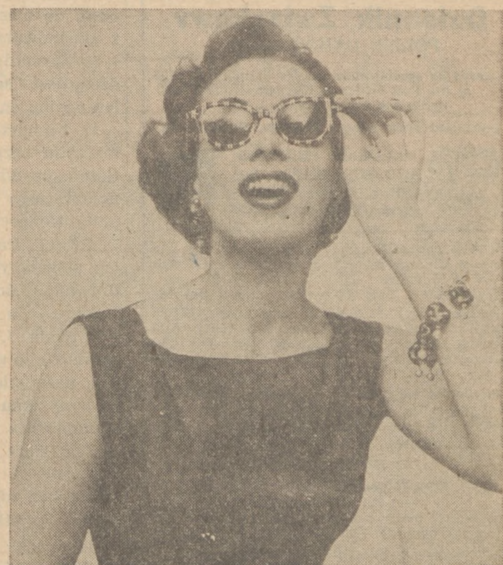
Już teraz należy pomyśleć o ciemnych okularach, które oszczędzają nasz wzrok podczas słonecznych dni lata. Powyższy styl ramek do okularów, z plastiką w kolorze czerwonym z białymi paskami, będzie napewno popularnym tego lata.