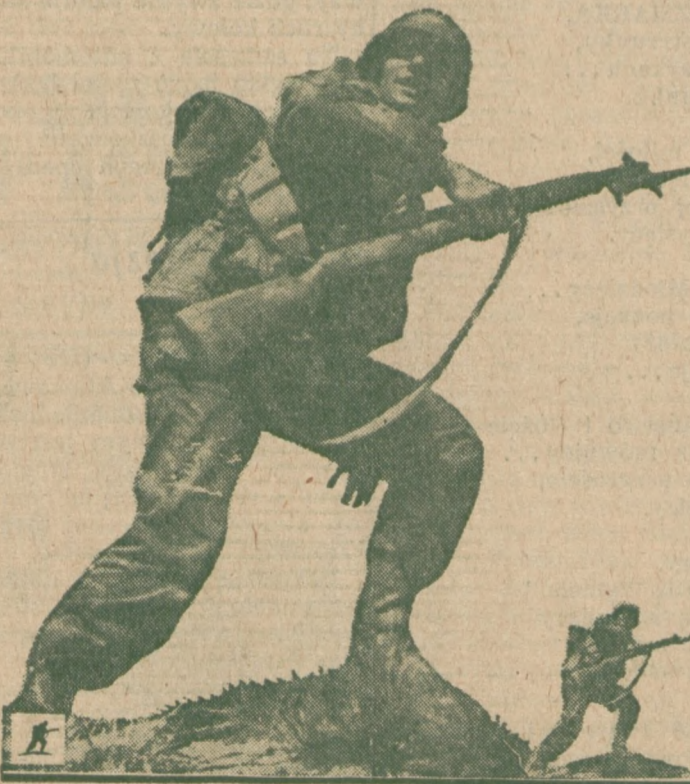
SIŁY ZBROJNE USA. — Na zdjęciu tym obrazowo przedstawiono stan ludzi w siłach zbrojnych Stanów Zjednoczonych w trzech okresach. Mała figurka w lewym dolnym rogu, reprezentuje stan sił zbrojnych w 1939 roku (około 500,000). Środkowa figura przedstawia około 12,000,000 w siłach zbrojnych USA w okresie zakończenia II Wojny Światowej. Trzecia na prawo obecny stan, około 3,000,000 ludzi.