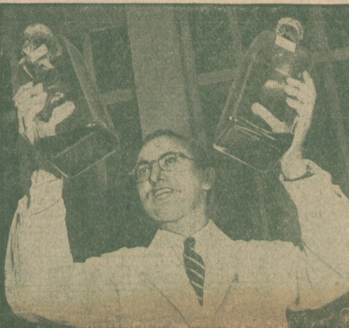
SZCZEPIONKA PRZECIW POLIO. —Odkrywa szczepionki przeciwko paraliżowi dziecięcemu, dr. Jonas Salk trzyma dwie butelki z tą szczepionką, która pozwolił z czasem na całkowite zwalczanie tej strasznej choroby. Szczepionka została wyprodukowana w laboratorium doświadczalnym Uniwersytetu Pittsburgh, Pa.