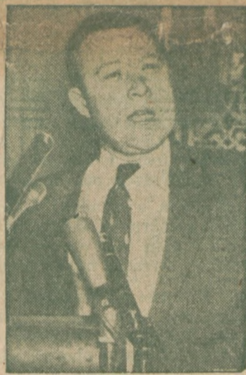
PODSTAWA PROSPERITY. — Prezes CIO, Walter Reuther, przemawiając w Krajowym Klubie Prasowym w Washingtonie oświadczył, że wprowadzenie gwarancji rocznego zarobku jest warunkiem prosperity gospodarczej kraju, pełnego zatrudnienia i skutecznej broni przeciwko komunizmowi. Reuther odmówił odpowiedzi, czy grozi obecnie strajk robotników przemysłu samochodowego.