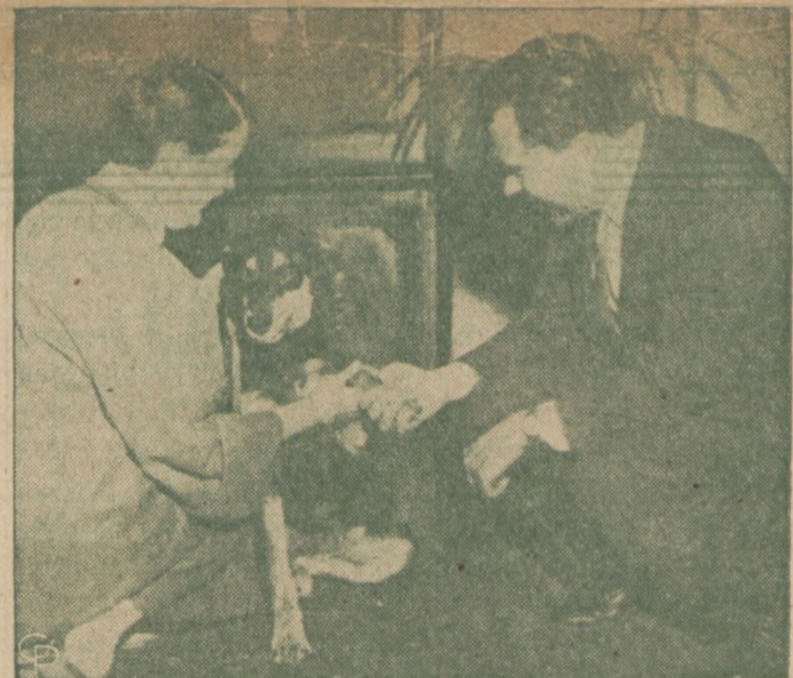
NA PRZYJĘCIU U WICEPREZYDENTA. — Wiceprezydent urządził przyjęcie "Open House" w swoim biurze na Kapitolu. Na zdjęciu wita się on z psem, który służy za przewodnika jednej z niewidomych, która przybyła na to przyjęcie. Na przyjęcie przybyło ponad 1,000 gości.