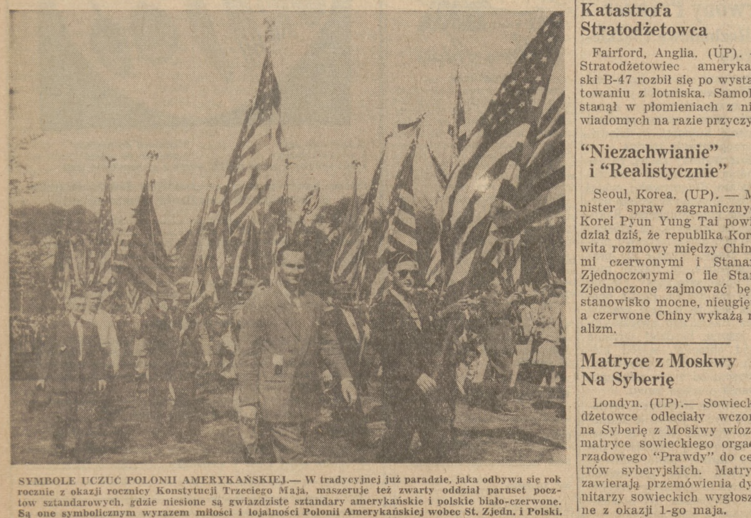
SYMBOLICE UCZUC POLONII AMERYKAŃSKIEJ. — W tradycyjnej już paradzie, jaka odbywa się rok rocznie z okazji rocznicy Konstytucji Trzeciego Maja, maszeruje też zwarty oddział paruset poczo- tow sztandarowych, gdzie niesione są gwiazdiste sztandary amerykańskie i polskie biało-czerwone. Są one symbolicznym wyrazem miłości i lojalności Polonii Amerykańskiej wobec St. Zjedn. i Polski.

Koła polityczne uważają wyniki wyborów w Sesto San Giovanni za znak, że komu- nicy zaczynają tracić wpływy we włoskim ruchu robotni- czym, które utrzymywali przez blisko 10 lat.