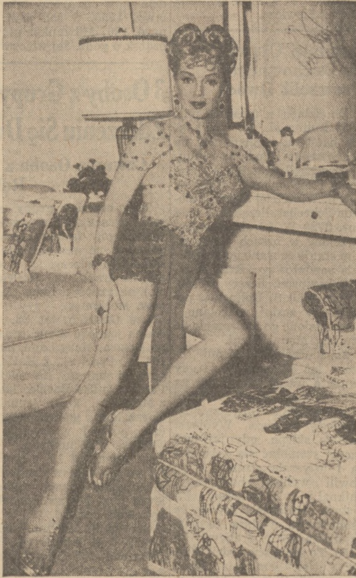
LANA TURNER relaxes prettily in her scanty costume in her dressing-room at the M-G-M Studio, which has Damascus in 70 B.C. for its background.