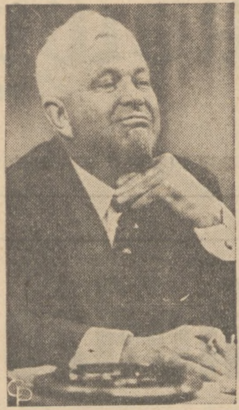
PRZECIW HOOVEROWI. — Sekretarz obrony Charles Wilson poddał krytyce raport komisji Hoovera, że w wojsku panuje marnotrawstwo i niekompetencja. Wilson powiedział, że Pentagon potrzebuje więcej ludzi pracy, a mniej specjalistów od krytyki.