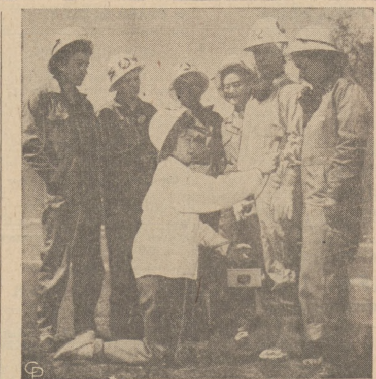
3.500 JARDÓW OD WYBUCHU ATOMOWEGO. — Członkinie kobiecego korpusu obrony cywilnej oglądają przed światem swoje stroje ochronne przeciwko radioaktywności, ponieważ o święcie dnia następnego mają być ukłokowane w odległości zaledwie 3,500 jardów od miejsca wybuchu atomowego na Yucca Flat, Nevada.