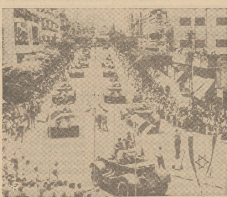
SIODMA ROCZNICA PAŃSTWA IZRAELA. — Pomimo wzrastającego napięcia pomiędzy Izraelem, a państwami arabskimi w Tel Awi obchodzą ostatnio uroczystość siódmej rocznicy niepodległości Izraela. Na zdjęciu czołgi w czasie deflady wojskowej, która ma zademonstrować gotowość armii Izraela.

Podsądny: — Jeśli łaska to wybieram sobie śmierć na uwiadł starcy, panie sędzio