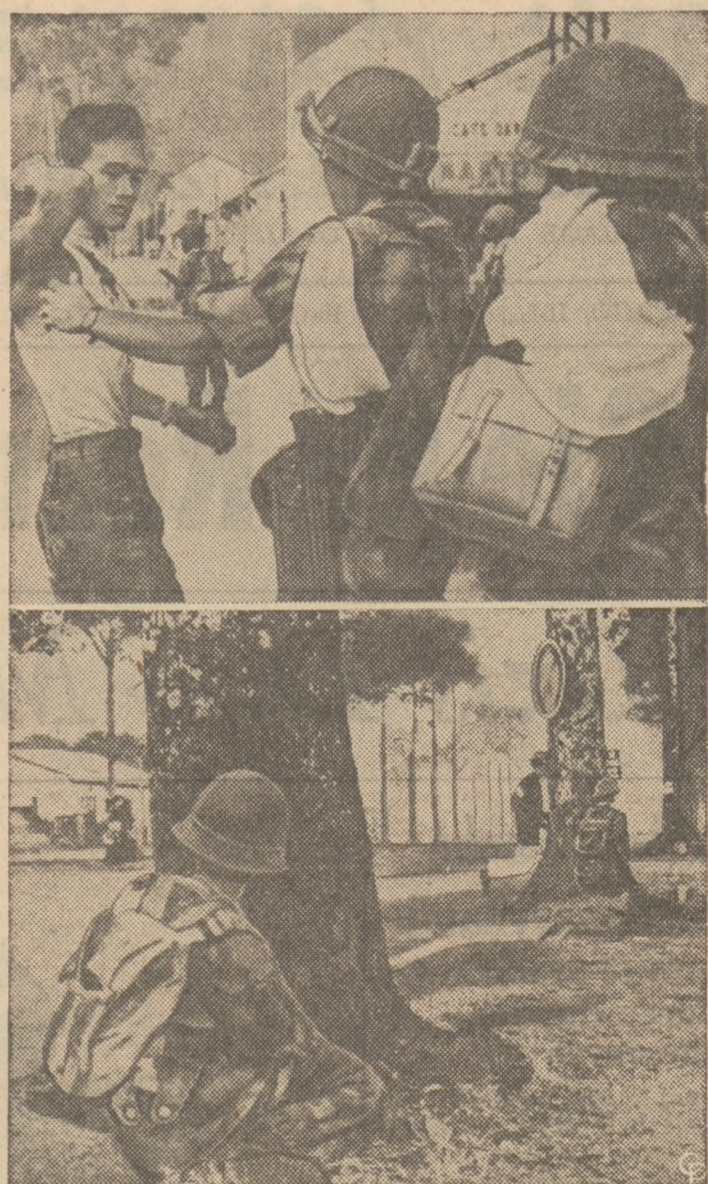
WOJNA CYWILNA W INDO-CHINACH.—Wojna cywilna w stolicy południowego Wietnamu w Indo-Chinach pochłania ciągle dalsze ofiary w życiu ludzkim i niszczy miasto i okolice materialnie. Na górnym sanitarisze zaopatrują rannego cywila, który został ranny na głównej ulicy Saigonu. Na dolnym żołnierz rządowy ostrzeliwuje się, znalazłszy ukrycie za drzewem.

Na dodatek sędzia McKenna powiedział ojcu: "Prawo będzie cię chronić."