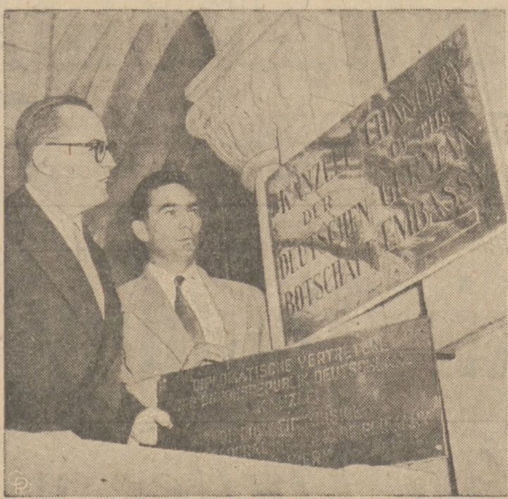
SYMBOL SUWERENNOŚCI NIEMIEC — Ambasador Federalnej Republiki Niemieckiej i jeden z pracowników ambasady zmieniają na gmachu budynku ambasady w Washingtonie, tablicę na której zamiast dotychczasowego napisu "misja" widnieje obecnie napis "ambasada". Po uzyskaniu suwerenności przez Niemcy zachodnie dotychczasowa misja została zamieniona na ambasadę. Republika niemiecka będzie przyjęta jako 15 członek do NATO.