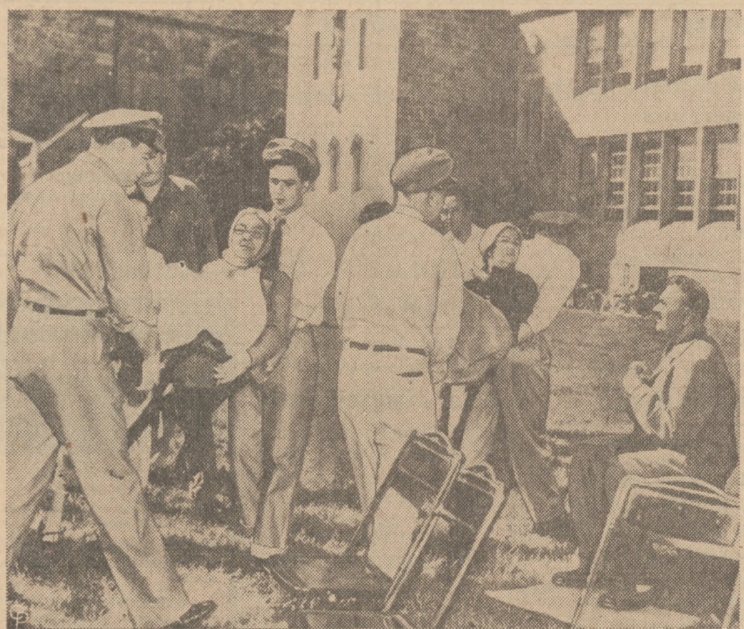
RATUJĄ PACJENTÓW Z PŁONĄCEGO DOMU DLA STARCÓW — Pożar wybuchł w domu dla starców z Baltimore, ale przybyła na czas straż ogniowa przy pomocy ochotników zdolała wynieść wszystkich tych mieszkańców domu, którzy nie mogli sami wyjść. Przeniesiono ich narazie do leżącego naprzeciwko kościoła katolickiego św. Ambrożego. Na zdjęciu przenoszenie chorych przez ulicę.

Sądy federalne rozpoczynają 10-tygodniowe wakacje z dniem 1 lipca.