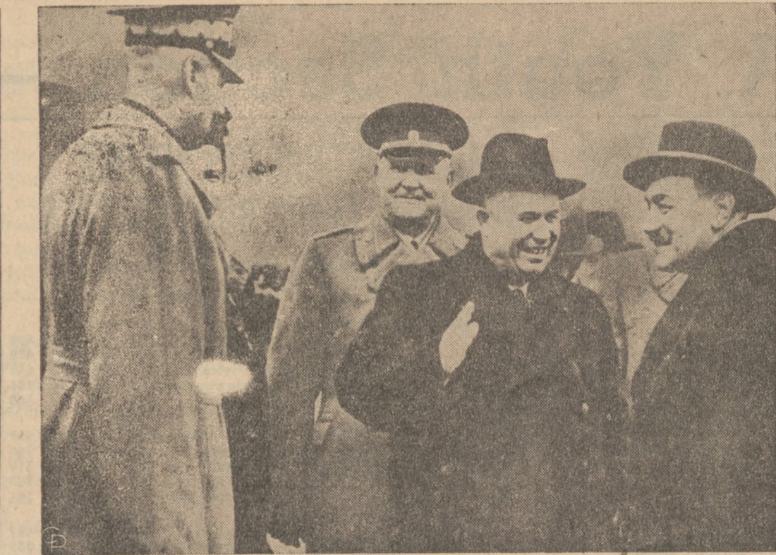
REZIMOWCY PRZYJMĄ SWOICH "BOSSÓW".—Z okazji uroczystości 10-lecia podpisania przez reżim warszawski paktu przyjaźni i wzajemnej pomocy z Sowietami, przybyli do Warszawy najwyżsi dyktatorzy moskiewscy. Na spotkanie swoich "bossów" pośpieszyli agenci reżimu. Od lewej: sowiecki reżimowy marszałek Rokossowski, sowiecki marszałek Koniew, Nikita Chruszczow sekretarz centralnego komitetu sowieckiej partii komunistycznej i sekretarz komitetu polskiej zjednoczonej partii rolniczej komunistycznej, Bolesław Bierut.

W sobotę, 28 maja, odbędzie się "Open House" i zabawa taneczna w Domu Wet. pnr. 1239 N. Wood ul., na którą komitet zaprasza wszystkich kolegów i koleżanki, oraz sympatyków, ażeby wspólnie zabawić się z delegatami i gośćmi.