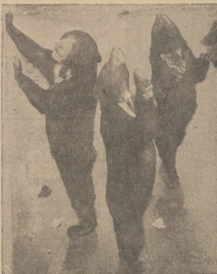
TANZACJE NIEDZIEDZIE. — Te trzy malajskie niedźwiedzie w ogrodzie zoologicznym w Helsinkach w Finlandii, nauczyły się tańczyć przed publicznością, by wyzwać więcej pomarańcz, orzechów i innych smakołyków.

KRAJE ZA ŻELAZNĄ KURTYNĄ CHCĄ WOLNOŚCI. — Sekretarz stanu John Foster Dulles przemawiając przez radio w audycji ogólnokrajowej, oświadczył, że obecnie, gdy została uwolniona Austria — także kraje — zagarnięte przez Sowietów liczą, że zostaną uwolnione. Obok Dullesa z prawej siedzi przysłuchujący się prezydent Eisenhower.