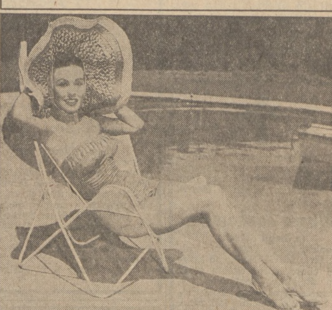
Jeanne Crain's latest movie is "Man Without a Star," a Western in which she looks not at all like this! So we thought we'd let you in on a peek at Jeanne at home. Starring for U-I with Kirk Douglas and Claire Trevor, Jeanne plays a cattle baroness who likes to put her brand on men as well as cattle.