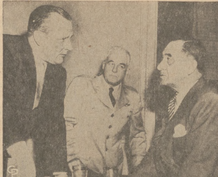
U. S. A. ZACHOWUJ SUPREMACJĘ LOTNICZĄ. Sekretarz lotnictwa Harold Talbot (na prawo) i szef sztabu lotnictwa gen. Nathan Twining (w centrum) w rozmowie z senatorem Williamem Knowland z Kalifornii po swoich zeznaniach przed senackim komitetem, który badał raport o wzroście i rozbudowie lotnictwa sowieckiego. Sekretarz Talbot oświadczył, że obecnie nie zachodzi obawa, by U. S. A. utraciła supremację w powietrzu na rzecz Sowieców.

Półowa życia miła, zanim zdołamy je poznać. Gdy poznamy wartość życia, jesteśmy już zoniaci.