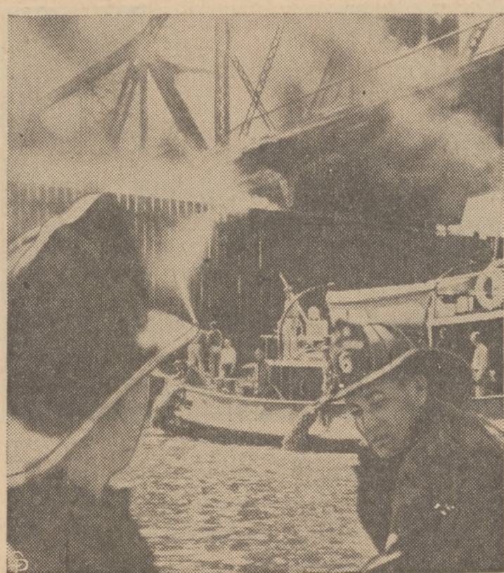
GAŚZĄ POŻAR MOSTU W NOWYM YORKU. Strażackie łódzkie gaszą pożar mostu kolejowego linii New York Central nad rzeką Hudson w Albany. Ogień uszkodził poważnie most. Przyczyny pożaru nie zostały ustalone.