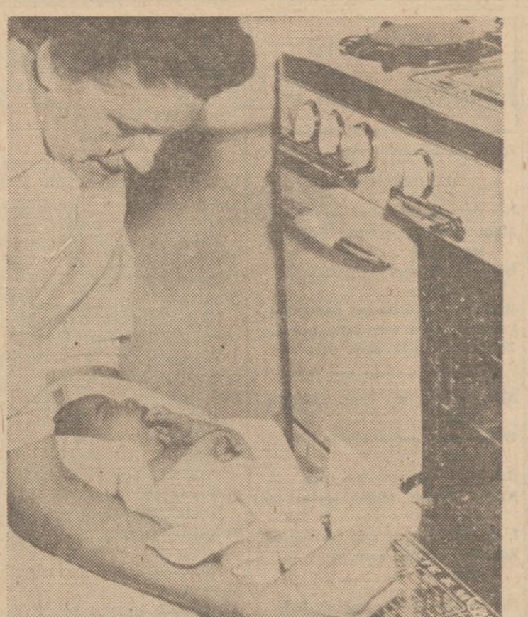
PORZUCONE NIEMOWLE.—W jednym ze szpitali w Los Angeles pielęgniarka ogrzewa zmarzone niemowle przy otwartym piecu. Dziecko to zostało znalezione na trawniku prywatnego domu i dostarczone do szpitala. Lekarz orzekł, że niemowle urodziło się na dwie godziny przed przywiezieniem go do szpitala.