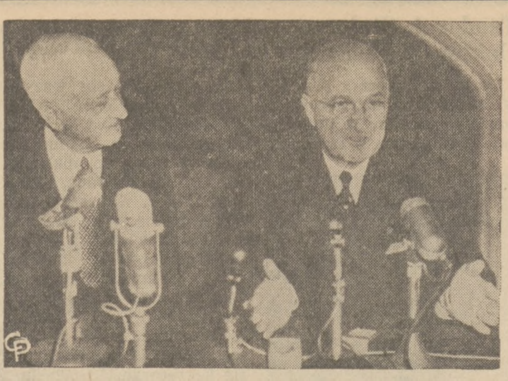
TRUMAN W CLEVELAND. Ostatnio był prezydent Harry Truman przybył do Cleveland, O., gdzie wygłosił przemówienie na obiedzie, który miał przysporzyć pieniądze na ogólną kwotę $75,000

— Zmęczenie jest normalne, bez względu na wiek. Powiadają, że główną przyczyną zmęczenia jest niedostateczne odżywianie.