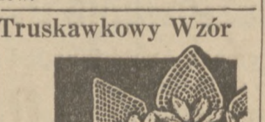
7335 by Alice Brooks Wzór 7335

Przy użyciu odpowiednich kolorów bawełny możecie wyszydełkować serwetki, które rzeczywiście będą wyglądać jak gdyby były ozdobione truskawkami.