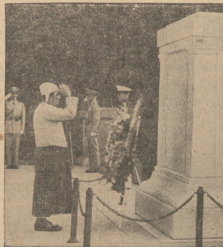
PRZY GROBIE NIEZNAJNEGO ŻOŁNIERZA. U Na, premier Burmy podczas ceremonii składania wieńca na grobie nieznanego żołnierza na cmentarzu Arlington. U Na odbywa obecnie turę po Stanach Zjednoczonych.

OBIECUEJ ZNIKNE PODATKÓW. Był Prezydent Herbert Hoover, w wywiadzie udzielonym dziennikarom w Washington, twierdzi, że jeśli przedstawione przez niego plany oszczędnościowe zostaną wprowadzone w życie, to będzie można zrównoważyć budżet państwa i obciążyć podatki o sumę dwa biliony dolarów.