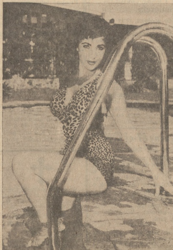
ELIZABETH TAYLOR resembles a very lovely lady Tarzan, wearing this bathing suit in a leopard design while taking her morning plunge in her pool. Liz's current M-G-M picture is "The Last Time I Saw Paris," but there's time out now for a Blessed Event.