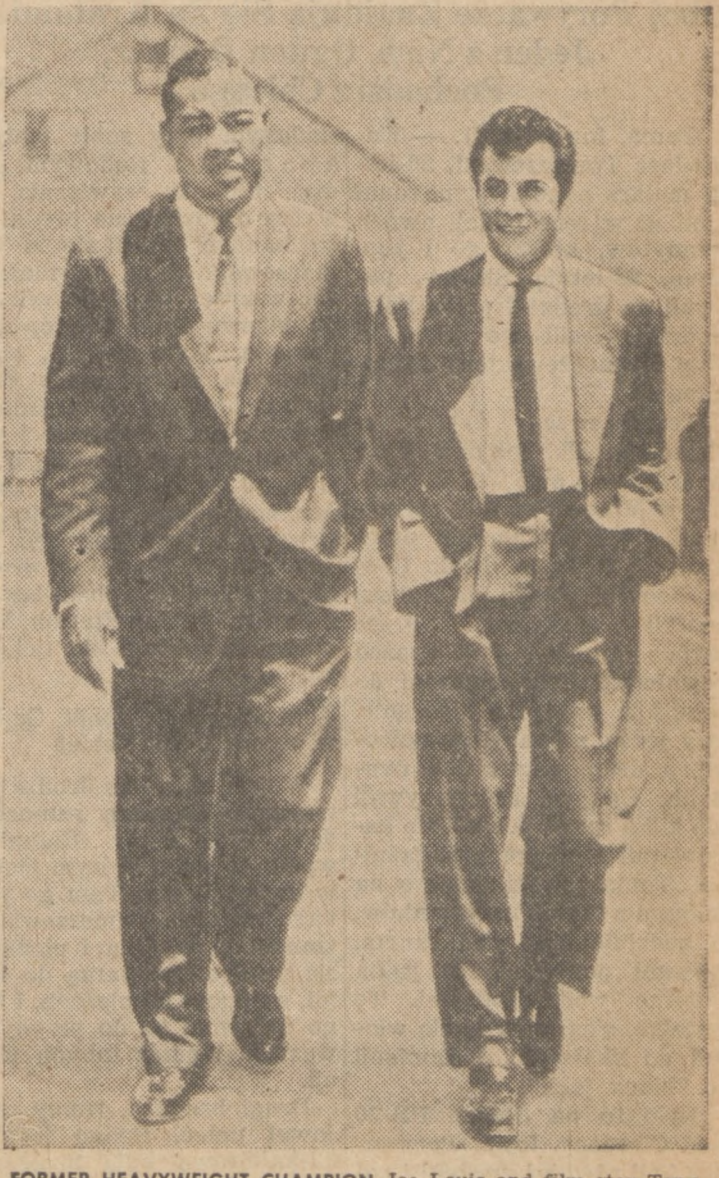
FORMER HEAVYWEIGHT CHAMPION Joe Louis and film star Tony Curtis are shown at Hollywood studio, where Louis is playing a role in "The Square Jungle," in which Curtis stars.