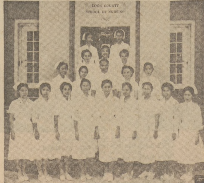
Nineteen happy smiles — eighteen girls and one man — testify that these graduate nurses from the Philippines are thrilled at arriving in America and at realizing their ambition in Chicago's great Medical Center with all the wonders of its advanced medical and nursing achievements. Here they have actually become students again and are taking nursing education and experience. To put it in their own words, these Filipino nurses consider the opportunity to come to America as a wise investment, not only for their own educational progress, but for the future of general health in their own country. All are preparing to return to positions of responsibility in their own hospitals and communities.