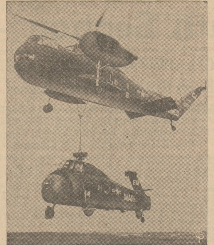
DEMONSTRACJA. — Potężny amerykański helikopter, HR-2-S demonstruje siłę, podnosząc kadłub innego samolotu, podczas popisów lotniczych w bazie strzelców morskich, w New River, N.C.

Dyrektor stanowego wydziału pracy, Roy F. Cummings raportuje że w tygodniu kończącym się dnia 1-go marca zgłoszono na terenie całego stanu 198,250 nowych aplikacji o zapomogi stanowe dla bezrobotnych. Była to liczba o 21,310 mniejsza niż w tygodniu poprzednim. Stratton popiera plan, ale po wyborach Znaczący to, iż w marcu zanotowano poraż pierwszy