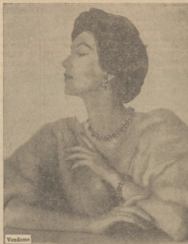
Sztuczna biżuteria jest obecnie tak piękna i pomysłowa, że trudno nieraz odróżnić ją od prawdziwej, wielce kosztownej.