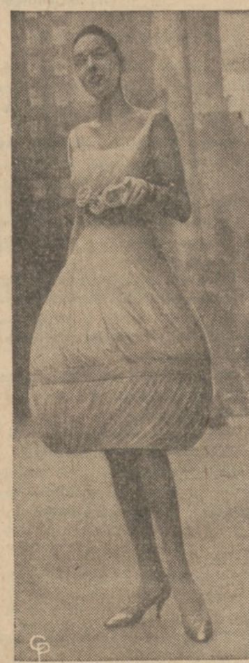
Najnowszej paryskiej mody suknią wieczorową w stylu balonowym. Suknia uszyta jest z niebieskiego szylonu.

Lecz faktem jest, że zameężne kobiety w ogromnej większości pracują nie dlatego, by zarobić sobie na zbytki, lub dla gromadzenia pieniędzy, ale po prostu dlatego, że z powodu szalonej drożyzny zarobki mężów nie wystarczają, by wiązać koniec z końcem i utrzymać rodzinę na amerykańskiej stopie życiowej.