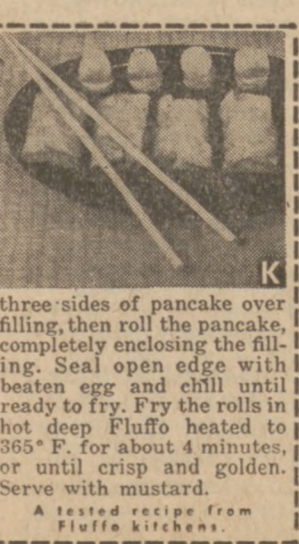
A tested recipe from Fluffo kitchens.

Appetizers Chinese Egg Rolls DEEP-FRIED Chinese specialty is easily duplicated in home kitchens. Egg Roll Pancakes (Makes 12) 1 egg, beaten 1/4 teaspoon salt 1/2 cup sifted enriched flour 1/2 cup water In a bowl combine egg, salt and flour. Stir in water to make a thin batter. Strain batter into a cup. Heat small frying pan (6 in. in dia.) and brush it lightly with Fluffo. Pour 2 tablespoons batter into the pan, swirl pan to coat it evenly with batter and pour surplus batter back into cup. Hold pan over heat for about 30 seconds, or until pancake is set, but not browned. Cook on one side only and turn out onto a damp towel. Repeat, first heating pan, as it is the heat of the pan that almost cooks the cakes. Roll cakes in the towel and store in refrigerator until ready to fill. Filling 1 can crab meat, flaked 1/2 cup minced celery 1/2 cup chopped green onions 2 tablespoons chopped parsley 2 tablespoons soy sauce 1 egg, lightly beaten Fluffo for deep frying Combine crab meat, celery, onions, parsley, soy sauce and salt and pepper. Place a spoonful of the mixture in center of each pancake. Fold