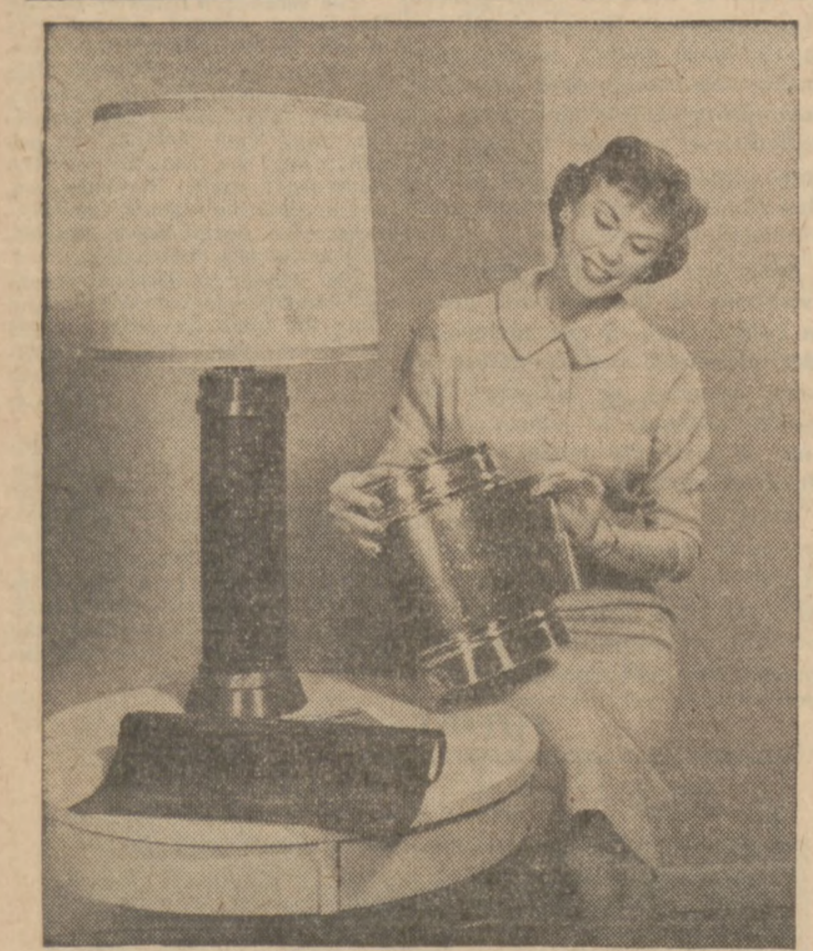
Na rynku ukazał się nowy materiał plastyczny "Marvalon" który nabyć można w różnych odcieniach i deseniach, i który użyć można do dekoracji lamp, koszy, wyściełania szuflad itd.

Appetizers Chinese Egg Rolls DEEP-FRIED Chinese specialty is easily duplicated in home kitchens. Egg Roll Pancakes (Makes 12) 1 egg, beaten 1/4 teaspoon salt 1/2 cup sifted enriched flour 1/2 cup water In a bowl combine egg, salt and flour. Stir in water to make a thin batter. Strain batter into a cup. Heat small frying pan (6 in. in dia.) and brush it lightly with Fluffo. Pour 2 tablespoons batter into the pan, swirl pan to coat it evenly with batter and pour surplus batter back into cup. Hold pan over heat for about 30 seconds, or until pancake is set, but not browned. Cook on one side only and turn out onto a damp towel. Repeat, first heating pan, as it is the heat of the pan that almost cooks the cakes. Roll cakes in the towel and store in refrigerator until ready to fill. Filling 1 can crab meat, flaked 1/2 cup minced celery 1/2 cup chopped green onions 2 tablespoons chopped parsley 2 tablespoons soy sauce 1 egg, lightly beaten Fluffo for deep frying Combine crab meat, celery, onions, parsley, soy sauce and salt and pepper. Place a spoonful of the mixture in center of each pancake. Fold