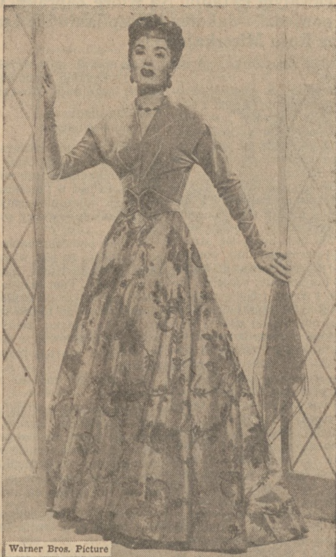
Ładny negligé, o brokadowej spódnicy i welwetowym staniku. Negligé modelowany jest przez gwiazdę filmową Ann Blyth, a kreacja pochodzi z wytwórni Warner Bros.

zasad moralności i lekkiego zapatrywania się na życie i związki małżeńskie. Już czas ażeby przykroć tej swawoli, a uczynić to może jedynie opinia publiczna. Hollywood obecnie zaczyna zbierać plon tych długich lat niemoralnego życia — gdyż kina obecnie świecą pustkami. Oby tylko ta rozwięzłość obyczajów "hollywoodskich" nie przeniosła się na telewizję, gdzie obecnie filmowanych jest większość programów telewizyjnych. Wobec lekkości obyczajów gwiazd filmowych i braku poszanowania do małżeństwa, które budzą niesmak u wszystkich uczciwych i szanujących swą godność ludzi, nie dziwnego, że młodzież, która lubi naśladować filmowców, wykazuje obecnie taką rozwięzłość w zachowaniu i zapatrywaniu. W Ameryce obecnie na małżeństwo młodzież zapatruje się z tego punktu widzenia, że zawsze można rozwieść się, jeżeli nie podobają się będzie żonie koloru oczu męża, lub odwrotnie.