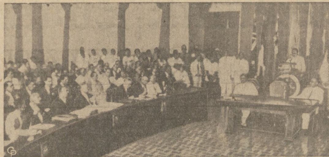
KONFERENCJA NA FILIPINACH. — W stolicy Filipin, Manili, odbywa się w tych dniach konferencja narodów południowo-wschodniej Azji, w której bierze także udział sekretarz stanu Stanów Zjednoczonych, John Foster Dulles.

DIABEŁ? TAK JEST! — Związki powyższe, odznaczające się wyjątkową wszechmocą i zaręczonością, i znane jest po nazwie "Tasmania devil", pochodzi z Tasmanii (czyli południowej w pobliżu Australii), gdzie napada na stada owiec, zabija wszystko co mu pod rękę wpadnie, się w dzień, a poje w nocy. Okaz powyższy umieszczony został niedawno w zoologicznym ogrodzie w Washingtonie.