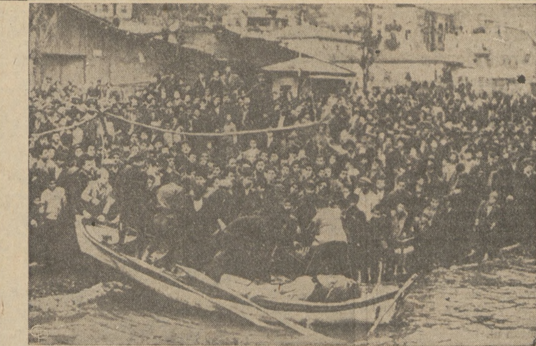
TRAGEDIA W TURCJI. — Krewni i rodziny tłoczą się nad brzegiem rzeki, usiłując rozpoznać wydobytą z wody zwłoki swych dzieci, których od 400-tu do 400-tu mogli ukończyć się w rzecę, gdy prom wyrzucił się we wzburzonych po wielkim deszczu falach na środku rzeki Izmit.

Gdynia. — (DP). — Milicja aresztowała tu znanego działacza kompartii i prezesa współdzielni dozorców nocnych. Miał on być jednocześnie szefem bandy złodziejskiej.