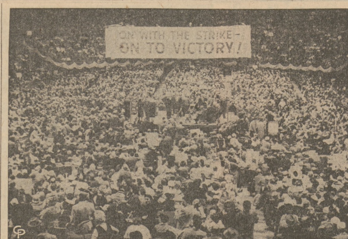
"NAPRZÓD DO ZWYCIĘSTWA" — Tak brzmiało hasło krawców newyorskich, którzy tłumnie zebraли się na terenie Times Square, by rozpocząć pierwszy w 25-ciu latach strajk generalny. Unia krawiecka liczy w siedmiu stanach wschodnich przeszło 105,000 członków, a w samym mieście New Yorku ma podobno przeszło 60,000 członków.

Program obecny, dowodził Braden, więcej Ameryce w opinii światowej szkodzi, niż pomaga, a równocześnie wychodzi także często na korzyść interesów komunistycznych.