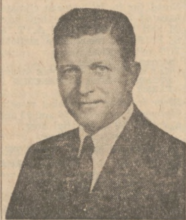
OTTO KERNER Sędzia Powiatowy

Sędzia Powiatowy, Otto Kerner zwrócił się do wszystkich tych, którym sprawy ważne nie pozwolą na osobiste głosowanie w prawyborach w dniu 8 kwietnia br., aby złożyli w Biurze Komisji Wyborczej, pokój 308, City Hall, swoje głosy. — Aplikacje na "Absentee Ballots" należy składać do wspomnianego urzędu w drodze listownej do 3 kwietnia, zaś osobiście — do 5 kwietnia, 12 godz. w poł.