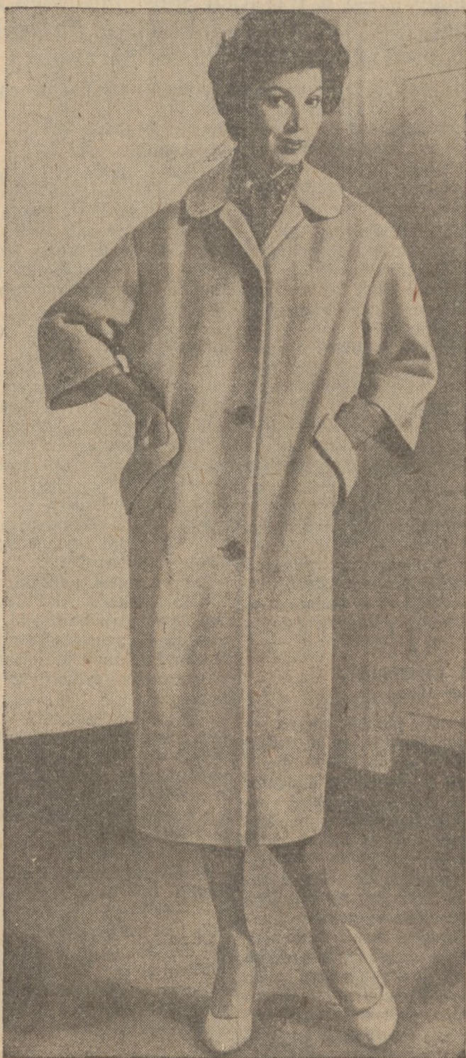
Plaszczki wiosenny i letni z wełny kaszmirskiej, o sportowych liniach.

DARMO! Prezenty Dla Każdego, Kto Przyjdzie!!!