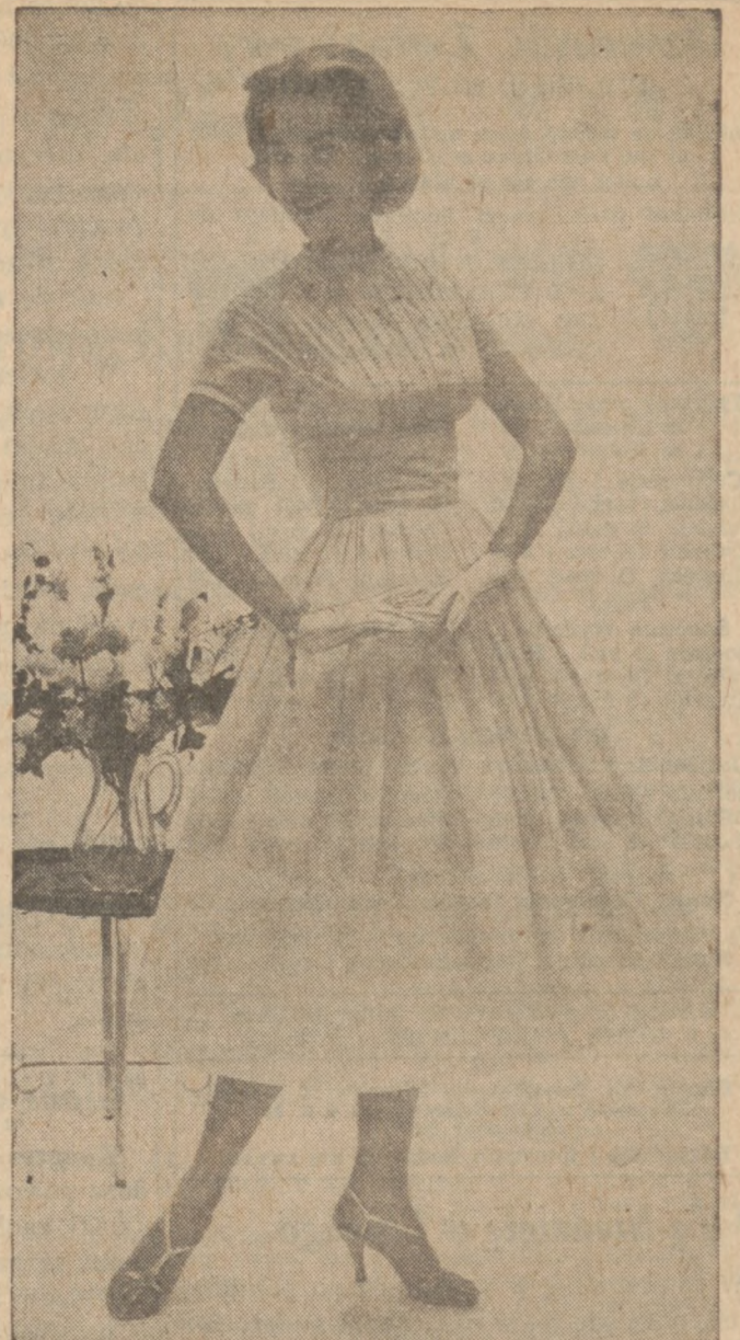
Sukienka z pralnego dakronu, dla studentki wyższej szkoły. Staniczek sukienki obszyty jest koronką.

Obecnie jest czas do przesadzania ostróżki (larkspur). Roślinę można podzielić dla lepszego wzrostu. Koniecznie dodać trochę