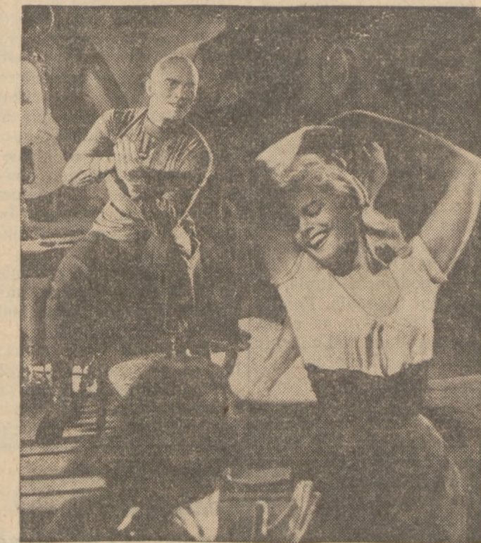
GYPSY DANCE... The passionate abandon of gypsy music and the admiration of Yul Brynner who Maria Schell into a fiery dance in MGM's much-discussed "The Brothers Karamazov."