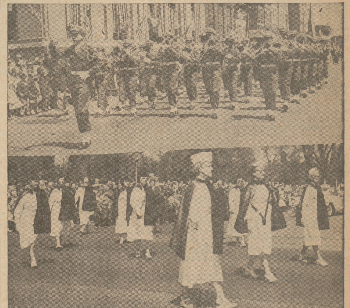
KAPELE I UMUNDUROWANE GRUPY stanowią w każdej manifestacji wielką i nader barwną atrakcję dla widzów, których dziesiątki tysięcy przypatrzyły się pochodowi na całej przestrzeni marszrut, od Domu Związkowego, aż do Pomnika Kościuszki, w Humboldt Parku. Powyżej widzimy dwie takie grupy: Kapelę Armii Amerykańskiej i oddział pań z Korpusu Pomocniczych. Zdjęcie powyższe dokonane zostało podczas pochodu majowego w ubiegłym roku.

Manifestacja ta bowiem przypomina, że Polska była jednym z pierwszych krajów świata proklamujących równość i wolność wszystkich obywateli, bez względu na rasę, klasy i wyznania religijne. Było to w roku 1791ym, a