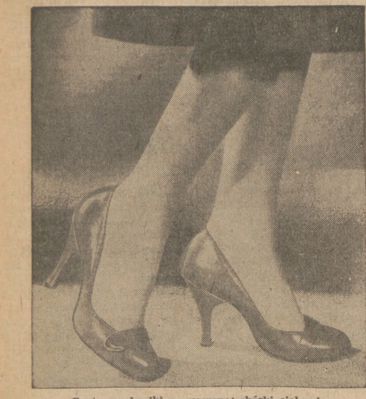
Gustowne buciaki z czerwonej skóry cięcej.