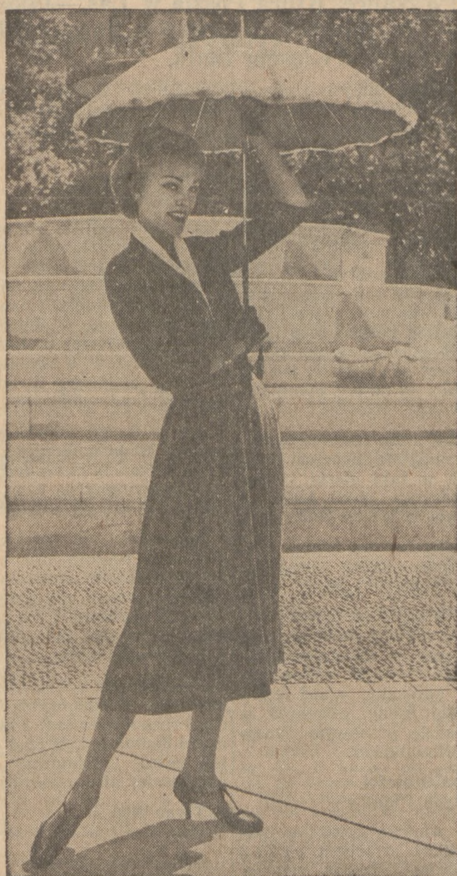
Plisowana sukienka z lekkiej pralnej flaneli, zaopatrzona blawim kotnikiem z piką.