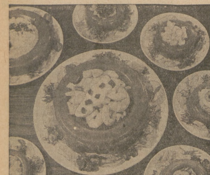
Gelatin molds of tomato aspic filled with shrimp or fish make attractive and delicious dinner entrees.

BY DOROTHY MADDOX Tomato Egg Loaf (8 servings) Part I: One envelope unflavored gelatin, 1 1/4 cups tomato juice, divided into 2 parts, 1/4 teaspoon salt, 1 tablespoon lemon or lime juice. Sprinkle gelatin on cold tomato juice in saucepan to soften. Place over low heat, stirring constantly until gelatin is dissolved. Remove from heat; add salt and lemon juice. Pour into loaf pan and chill until almost firm. Part II: One envelope unflavored gelatin, 1/2 cup cold water, 1 teaspoon salt, 2 tablespoons lemon juice, 1/4 teaspoon Worcestershire sauce, dash cayenne pepper, 1/4 cup mayonnaise or salad dressing, 1 1/2 teaspoons grated onion, 1/2 cup finely diced green onion, 1/4 cup finely diced celery, 1/4 cup finely diced green pepper, 1/4 cup chopped pimiento, 4 hard-boiled eggs, chopped. Sprinkle gelatin on cold water in saucepan to soften. Remove from heat; add salt and lemon juice. Worcestershire sauce and pepper. Cool. Gradually add gelatin mixture to mayonnaise; mix in remaining ingredients. Turn on top of tomato loaf in loaf pan. Unmold and garnish with ripe olives and salad greens. Serve with French dressing or mayonnaise. Note: 1 cup flaked tuna or salmon can be used in place of the eggs.