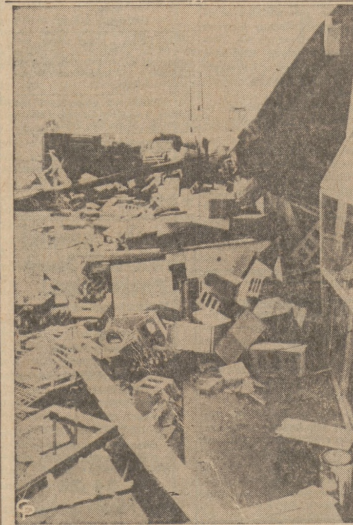
TRABA POWIETRZNA PRZEWAŁIŁA SIĘ PRZEZ INDIANE. — Gwałtowna traba powietrzna, która nawiedziła ostatnio środkową część stanu Indiana, wyrzuciła tam kolosalną szkodę. W miejscowości Newcastie nlicie miasta zablokowane zostały gruzami zburzonych domów, a w różnych punktach stanu zauważono kilka leżących z chmur, które przechodziły góra, szczęśliwie nie dotknęły ziemi.

Zwracając się do Ricca sędzia Miner napiętnował go, twierdząc, że stał się on "okazem zbrodniczości z tendencją do zdemoralizowania młodzieży, skorumpowania starszych i przyniesienia wstydu i hańby narodowi, jako rozwieżniemu i bezprawnemu". Taka działalność zagraża całemu naszemu dobrobytowi i jest