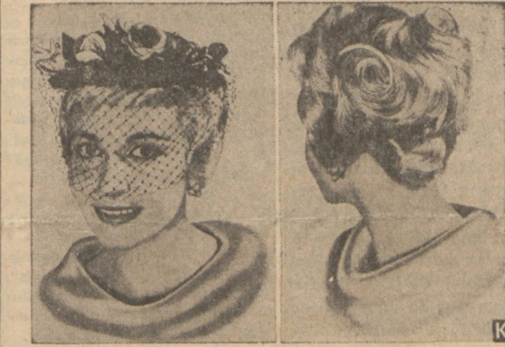
Najmodniejsze obecnie style uczesania włosów na sezon letni.