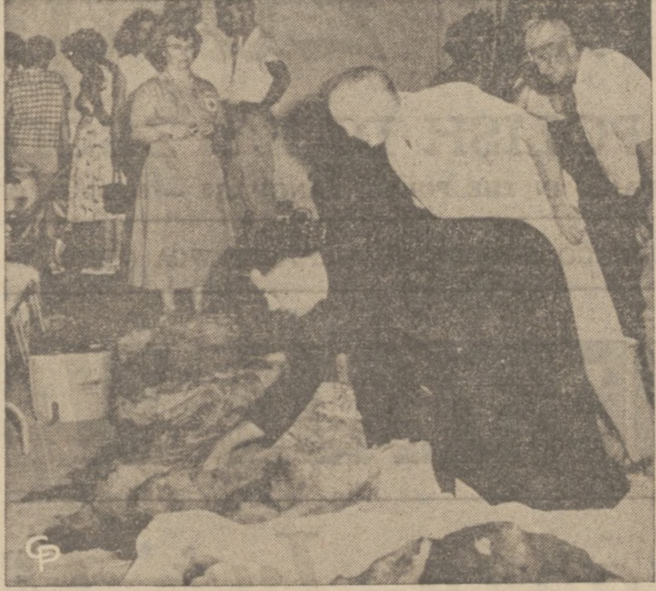
OFIARA HURAGANU. Nad zwłokami ofiar burzy w El Dorado, Kans. pochyla się ksiądz, udzielając ostatnich namaszczeń. W mieście tym zginęło 14 osób, 57 odniosło poważne okaleczenia a 150 domów zostało zniszczonych.