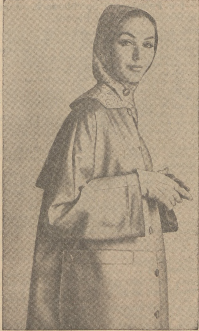
Nieprzemakalny płaszcz i czapeczka na deszczowe dni.

Lepiej jeśli córka nauczy się gotować w domu od matki, aniżeli później ma znieść wymówki męża za jej niezadanie. Lepiej poświęcić trochę czasu na naukę w domu, aniżeli później wydawać pieniądze na lekarzy dla leczenia się z chorego żołądka, lub też adwokatów na rozwody.