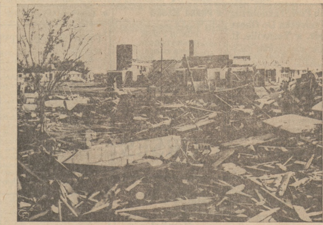
PO PRZEJŚCIU HURAGANU. — 150 domów w El Dorado, Kansas, uległo kompletnemu zniszczeniu po przejściu huraganu. W miasteczku tym zamieszkuje 12,000 osób z których 14 straciło życie, a 57 uległo poważnym okaleczeniom.

Normalnym terminem jest 15 czerwiec, ze względu na niedzielę, termin płatności przesunięty został na 16-go czerwca, w poniedziałek.