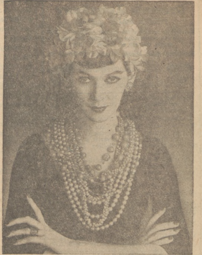
Kapelusze ze sztucznych kwiatów, to najnowszy krzyk mody paryskiej.

Gdy w ten sposób będziemy postępować, a mimo to przyjaciół nie zdobędziemy, to znaczy, że nie ma w naszym otoczeniu odpowiednich na przyjaciół ludzi. Nie powinniśmy się tym zrażać, lecz czekać cierpliwie. Znajdziemy ich później.