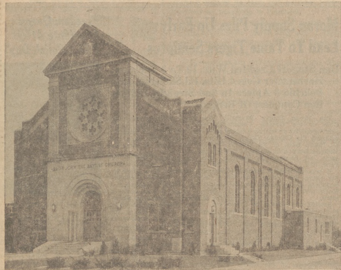
Nowy Kościół Św. Jana Chrzciciela w Phoenix, Ill.