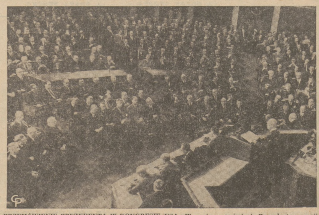
PRZEMÓWIENIE PREZYDENTA W KONGRESIE USA—W czasie przemówienia Prezydenta na sesji wspólnej w Kongresie, siedzą w przednim rzędzie członkowie Najwyższego Sądu oraz członkowie Gabinetu...

Na sobotnią Konwencję przybędzie do hotelu Sherman ponad 500 delegatów, reprezentujących 8,296 członków z Departamentu policji w Chicago.