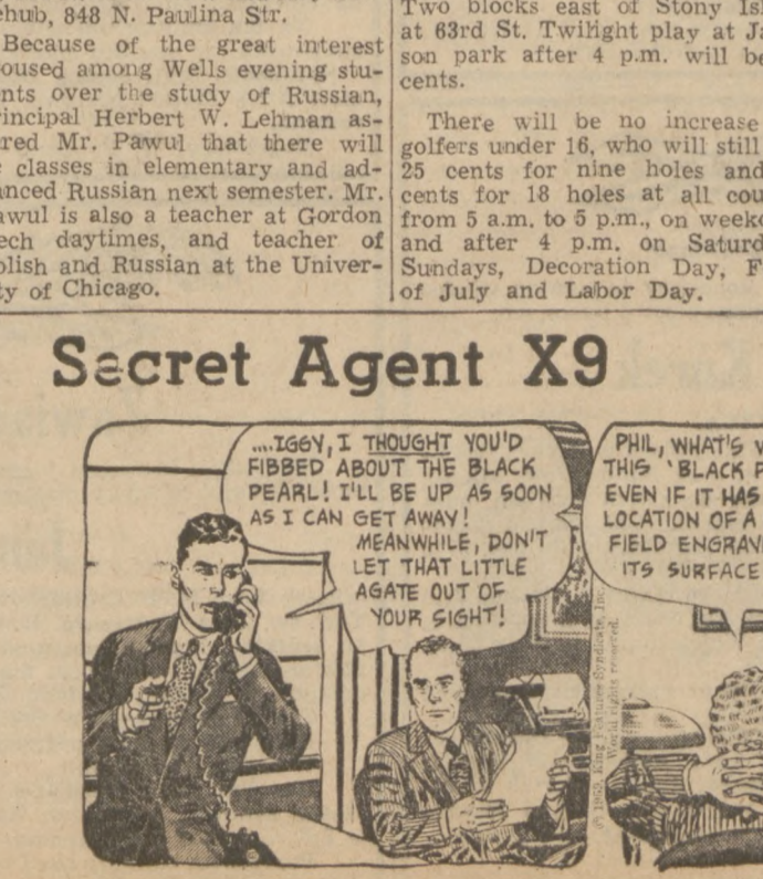
Secret Agent X9