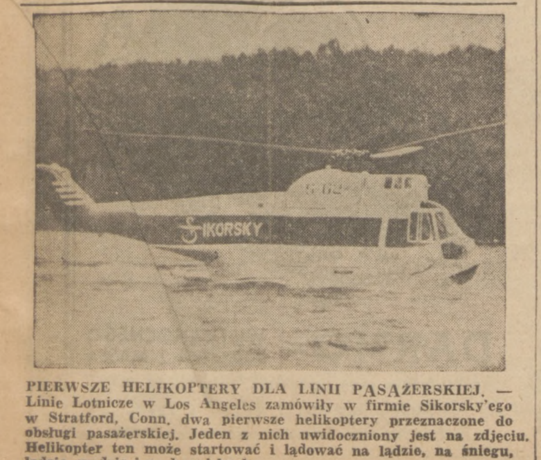
PIERWSZE HELIKOPTERY DLA LINII PASAŻERSKIEJ. - Linie Lotnicze w Los Angeles zamówiły w firmie Sikorskiego dwa pierwsze helikoptery przeznaczone do obsługi pasażerskiej.