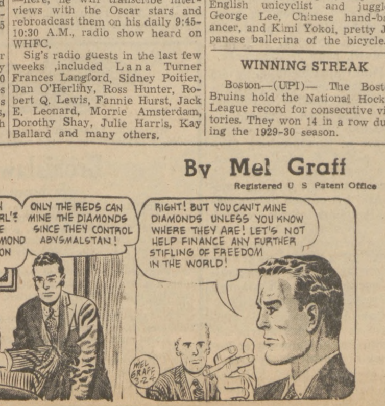
By Mel Graff