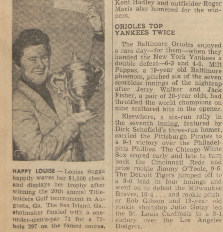
HAPPY LOUISE—Louise Suggs happily waves her $1,000 check and displays her trophy after winning the 20th annual Titleholders Golf tournament in Augusta, Ga. The Sea Island, Ga., shotmaker finished with a one-under-par 71 for a 72-hole 297 on the famed course.