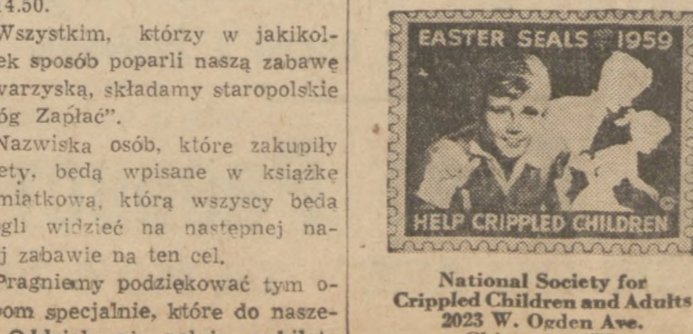
HELP CRIPPLED CHILDREN National Society for Crippled Children and Adults 2023 W. Ogden Ave. Chicago 12, Ill.

★ PRACA ŻENSKA Dziennik Związkowy 1201 MILWAUKEE AVE. Chicago 22, Ill.