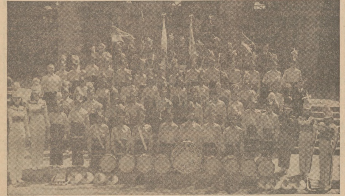
Drużyna Trębaczy i Doboszków Post. Woodrow Wilson No. 20 P. L. A. W.

Właśnie dziś zebrała się Konferencja 4-ch Ministrów w Paryżu, która będzie rządziła nad przygotowaniem programu "Konferencji Szczytowej" w lecie, na której sześćwie 4-ch wielkich mocarstw będą omawiali sprawy Europy Środkowo-Wschodniej, a więc także i przyszłości Polski w związku z kryzysem Berlina i sprawą zjednoczenia Niemiec.