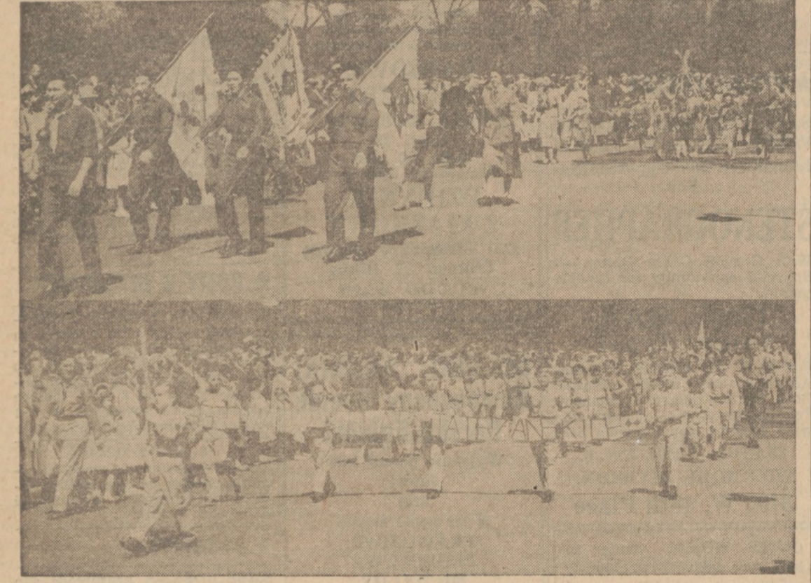
Malownicze oddziały Harcerzy i Zuchów—w Pochodzie Majowym

Jako zwolennik międzynarodowej współpracy i wzajemnego bezpieczeństwa sen.