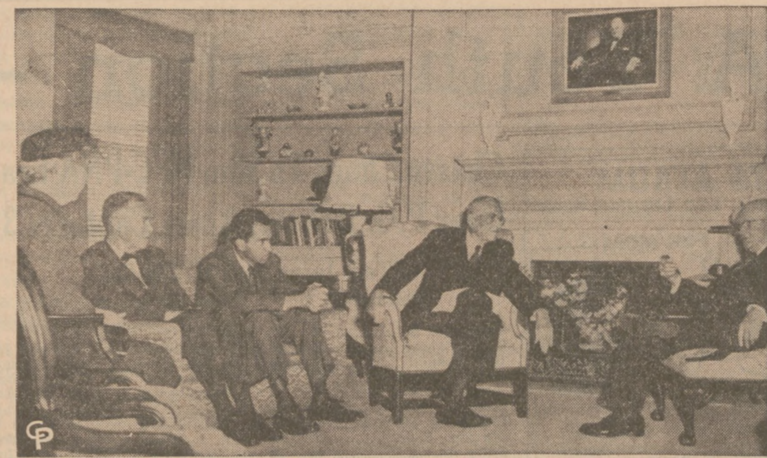
DULLES PRZYJMUJE NOWĄ ROLE. — Prezydent Eisenhower wraz z towarzyszącym mu wiceprezydentem Nixonem oraz nowym Sekr. Stanu Christian Herterem udali się do szpitala dla odwieczenia cierpiącego John Foster Dullesa, byłego Sekr. Stanu. W czasie rozmowy była obecna małżonka Dullesa. Prezydent zaproponował Dullesowi przyjęcie nowej roli jako specjalnego Doradcy Prezydenta w sprawach polityki zagranicznej. Propozycja Prezydenta została przyjęta. Nową rolę jaką b. Sekr. Stanu Dulles będzie pełnił, Prezydent określił jako jeszcze jeden dowód złożenia uznania b. Sekr. Stanu jego wspaniałego ducha i poświęcenia się dla spraw Narodu.

Upriejnie proszę o odszukanie i podanie mi adresu rodziny Micha-