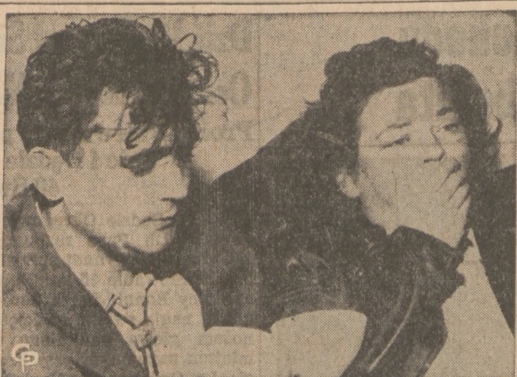
ZAKŁADNICY OPOWIADAJĄ O TERRORZE. Zmęczenie i przestraszenie widnieją na twarzach tego małżeństwa po uwolnieniu ich z rąk strażników więziennych w Deer Lodge, Mont., gdzie byli zakładnikami. Wśród innych zakładników znajdowali się strażnicy więzienni, urzędnicy oraz 5 więźniów—stojących po stronie strażników. Przez 36 godzin bez przerwy grozono im zastrzeżeniem, powieszeniem, zakłuceniem nożami lub spalaniem. Wszyscy zostali zwolnieni cało.

Centrala na Town of Lake, przy której skupiają się polskie organizacje, kucpy, przemysłowcy i profesjonalści, zaprasza wszystkich zrzeczenia, które jeszcze do Centrali nie należą, aby nadesłały swoich reprezentantów na posiedzenia, które odbywają się co trzeci piątek miesiąca. Zarząd Centrali z panią K. Spisak na czele zaprasza wszystkich delegatów i