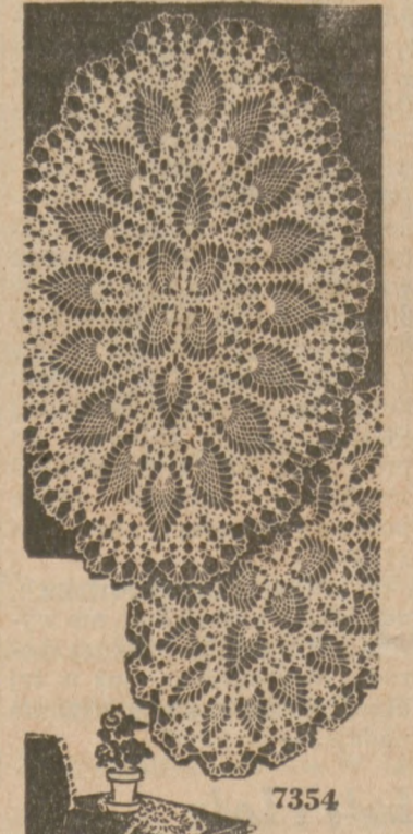
Wzór 7354 Podług tego wzoru możecie wyzdełkować komplet serwetek jedną dużą na średnie stoły, średnią pod talerz i mniejszą na talerz z chlebem.

Wzór 7354 obejmuje wskazówki wyszdełkowania serwetki 17x25 cali, 13x18 i 8x14 1/2 cali z bawelny Nr. 30.