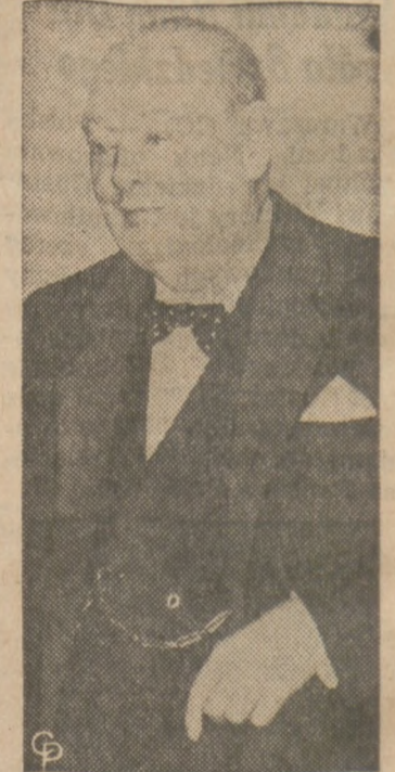
UBIEGA SIĘ O URZĄD Winstan Churchill, mimo że leży dziś lat 84, oświadczył, że będzie się ubiegał o Parlament w Brytanii w następnych wyborach krajowych.