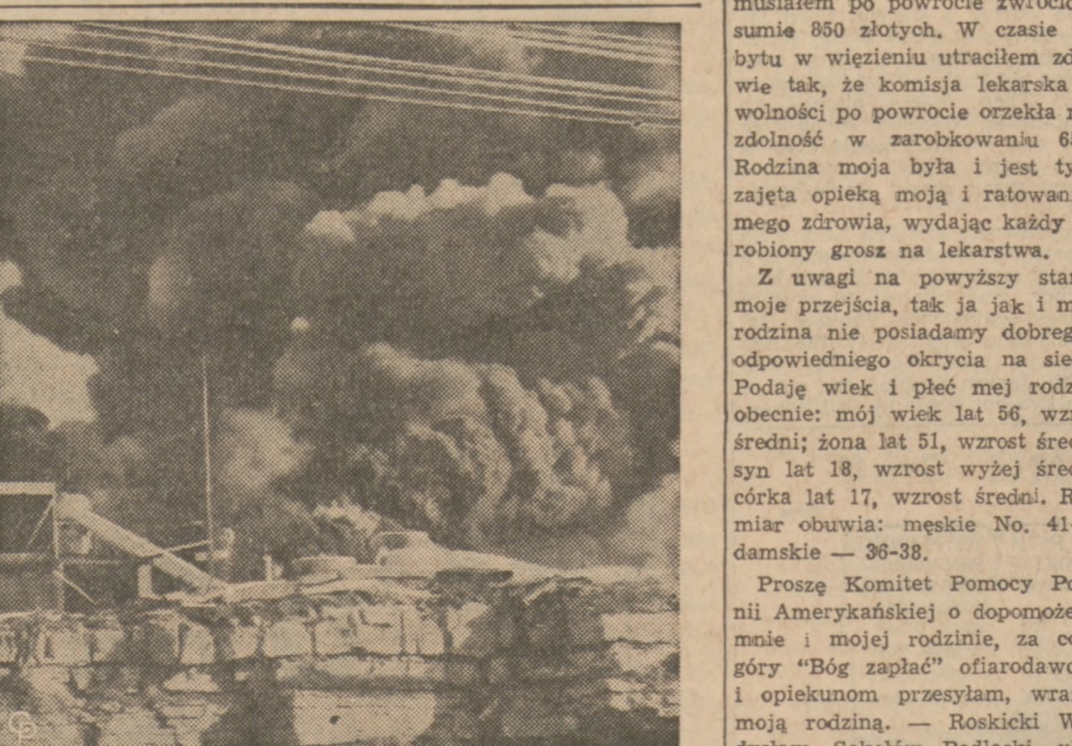
EKSPLOZJA I POŻAR W FABRYCE W KANSAS CITY. — W fabryce Chemicznej Thompson-Hayward w Kansas City, Kan., nastąpiła eksplozja...