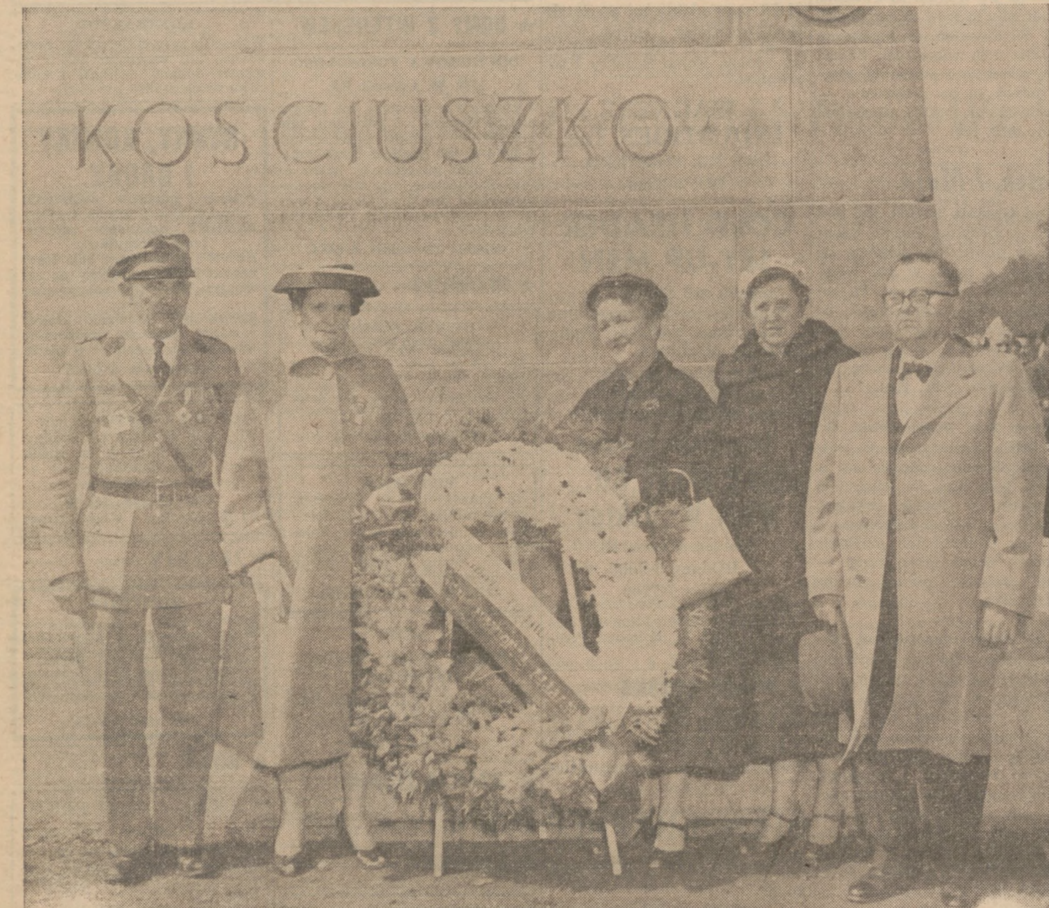
Tradycyjne złożenie wieńca u stóp pomnika Kościuszki — w czasie Manifestacji Majowej

Z Legionów Dąbrowskiego szła z Włoch przez Paryż i Niemcy do Kraju wkraczała wraz ze swym generałem do Poznania, biła się z Prusakami pod Gdańskiem, z Austriakami pod Raszynem, z Rosjanami pod Borodino i Lipskiem, chłoneła w siebie hasła rewolucji francuskiej i napoleońskiej.