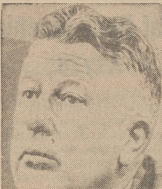
SEKRETARZ OBRONY — Sekretarz Obrony, Neil McElroy, przedstawia raport (na zdjęciu) do Stany Zjednoczone, mają prawo do użycia wschodnio-niemieckiego korytarza powietrza na takiej wysokości, na jakiej tylko kraj nasz sobie tego życzy.

DO HOWANCA WIĘC PODJEMNY — MEBLE SOBIE WYBIERZEMY, GNIAZDKO SOBIE USŁIEMY — ON TAM WSZYSTOKA MA!