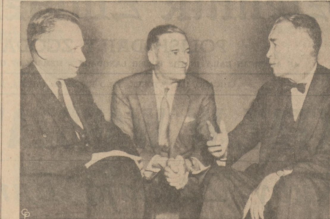
ROZŁOŻA HERTERA Z SZEFEEM ZJEDN. NARODÓW, HAMMARSKJÖLD. — W Departamencie Stanu w Waszyngtonie, nowy Sekretarz Stanu Christian A. Herter (z prawej) odbył dłuższą rozmowę z Gen. Sekretarzem Org. Zjedn. Narodów Dag Hammarskjöld. Sekretarz Herter wyraził opinie, że Zachód zgodził się na przyjęcie wspólnej strategii w rozmowach z przedstawicielem sowieckim co do Berlina i Niemiec Zach. W środku, na zdjęciu — ambasador Stanów Zjedn. Narodów, Henry Cabot Lodge.