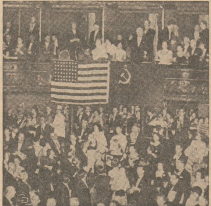
PO WYSTĘPIE BALETU WOLSZOJ W NEW YORKU. Oto obrazek z widowiska przedstawienia "Romeo i Julia"...