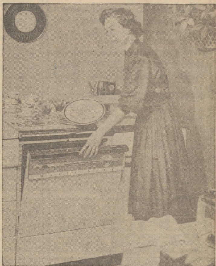
Automatyczna maszyna do mycia naczyń znajduje się we wielu kuchniach amerykańskich. Większość gospośi jest jednak zdania, że utrzymanie maszyny w czystości wymaga więcej pracy niż mycie naczyń ręcznie.

50,000 nieślubnych dzieci... w High School... gdzie dziewczęta liczą przeciętnie piętnaście lat.