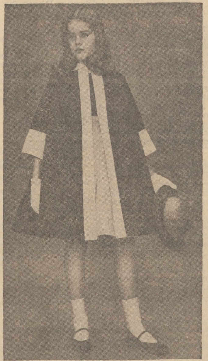
ładny płaszcz dla podrastającej pani. Płaszcz z lekkiej granatowej wełny, przybrany jest białą piką.

Kochać — to cenić zbyt wysoko. Nie kochać, to źle sądzić.