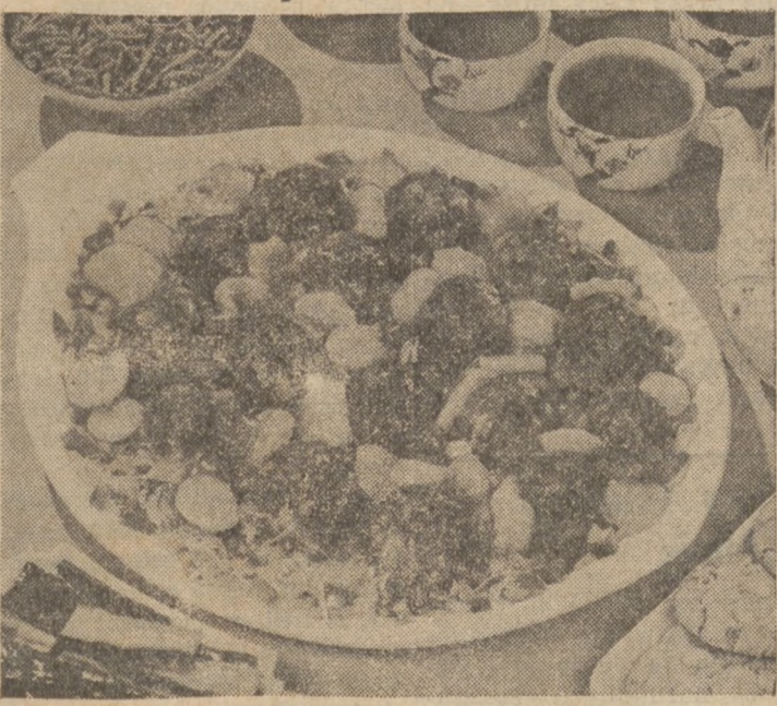
These exotic meat balls dressed up with sweet sour cucumber peels make a lively, guest-pleasing entree.

Polynesian Meat Balls (5 servings) One cup soft bread crumbs, 1 teaspoon salt, 1/4 teaspoon pepper, 1/2 cup chopped onion, 1/2 cup milk, 1 tablespoon soy sauce, 1 pound ground beef, 1/2 cup sugar, 1 1/2 tablespoons cornstarch, 1/4 teaspoon ground ginger, 1 cup pineapple juice, 2 tablespoons vinegar, 1 tablespoon butter or margarine, 1 (8-ounce) can water chestnuts, drained and cut into 1/4-inch slivers, 2 (1 pound) cans bean sprouts, 1/4 cup chopped onion, 1 cup coarsely chopped green pepper.