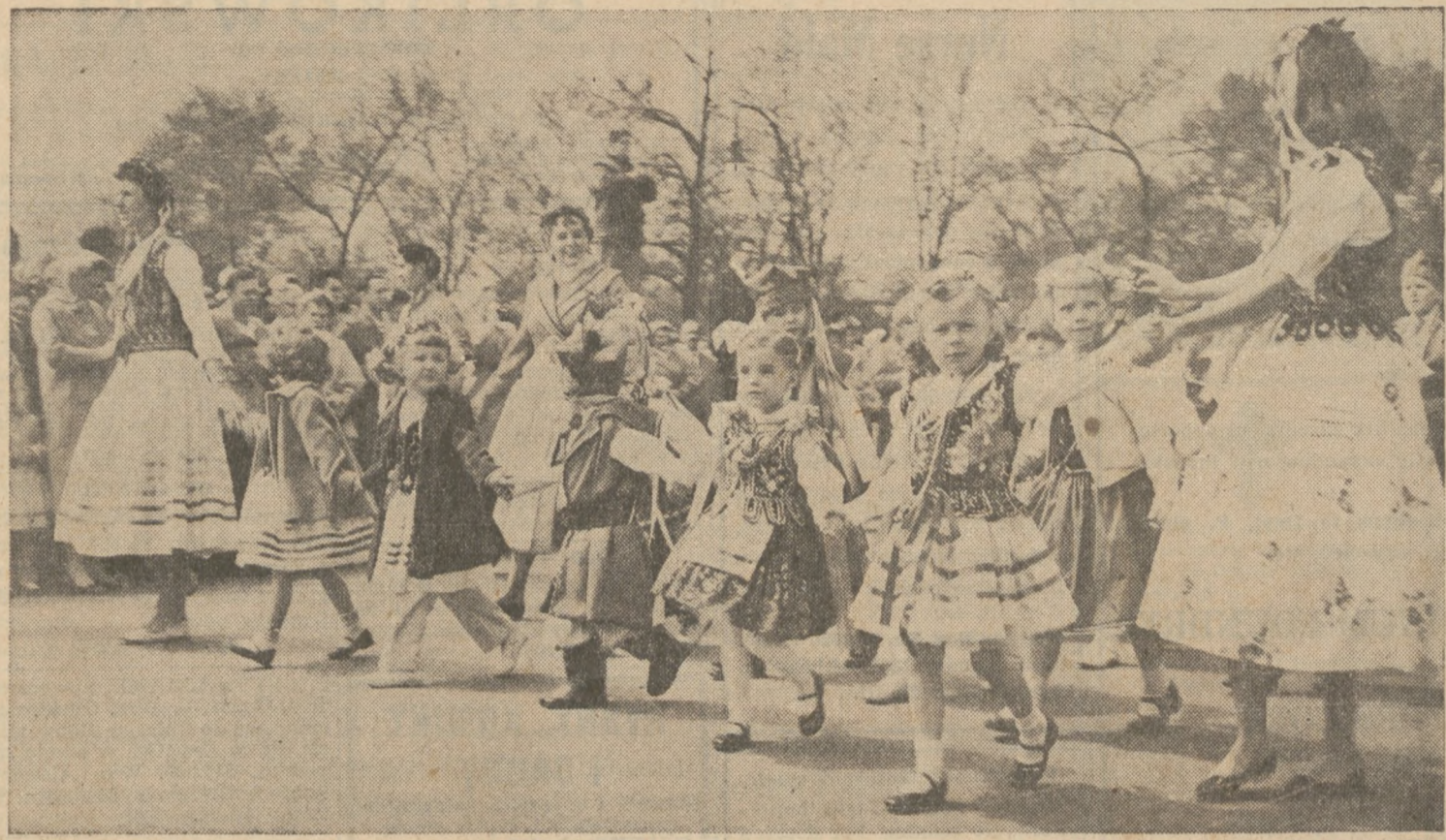
Działwa ze Szkółki Polskiej Wydziału Stanowego Kongresu Pol. Amer.