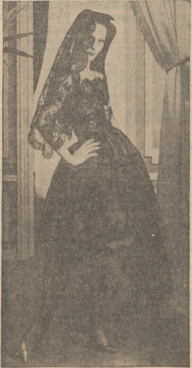
Wpływ hiszpański daje się zauważyć dobitnie w powyższym suknie wieczorowej z koronki, do której noszona jest mantyla z koronki. Kreacja Yves St. Laurent z firmy Diora w Paryżu, spotkała się z aprobatą znawczyń mody.

Organizm nie zawsze równomiernie się starzeje i bardzo często ku strapieniu kobiety, starzeje się przedwcześnie twarz, podczas, gdy reszta ciała jest zupełnie zdrowa i młoda.