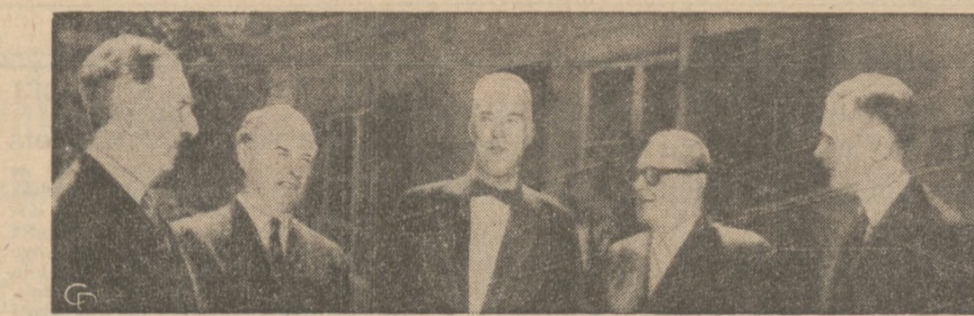
W PRZERWIE KONFERENCYJNEJ W GENEWIE. — W czasie jednej z przerw w czasie konferencji ministrów spraw zagranicznych wielkiej czwórki w Genewie, zebrał się wszyscy należący do zachodniego bloku. Są to, od lewej: włoski minister spraw zagr. (jako gość) Giuseppe Pella, bryt. minister spraw zagr. Selwyn Lloyd, Sekretarz Stanu USA, Christian Herter, minister spraw zagr. Zach. Niemiec, Heinrich von Brentano (jest tam jako doradca). — Ostatni w prawo — to min. spraw zagr. Francji, Maurice Couve de Murville.

W międzyczasie na gruntach spalanej farmy mleczarni Brook Hill, przy Milwaukee, inżynierowie i budowniczyszykują już plany i przygotowują prace na postawienie nowych budynków i wszczęcia przerwanej produkcji mleka specjalnego dla niemowląt na starym miejscu. Jak oznajmił prezydent tej firmy.