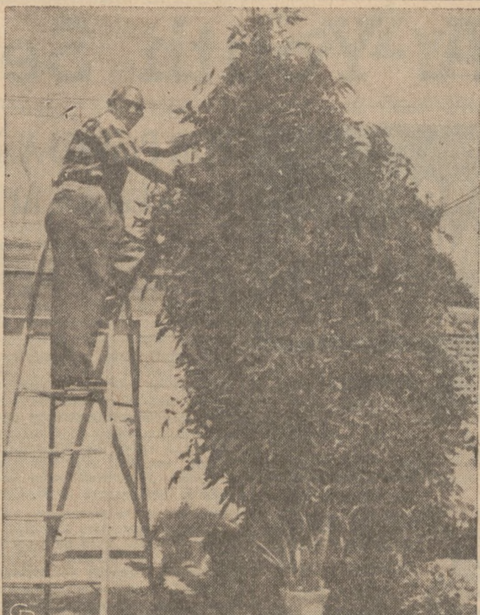
POTEŹNY KRZEW POMIDOROWY. —Joseph Maccoca musi w swym ogrodzie w San Diego, Kalif. użyć 10-stopowej drabiny, aby zebrać pomidory z krzewu, który wyrósł na wysokość 13 stóp. Wysokość krzewu jednak nie świadczy, aby i rozmiar pomidorów stał w tym samym stosunku do normalnych.

Czytając "Dziennik Związkowy" dostajecie co dzień najświeższe wiadomości z całego świata.