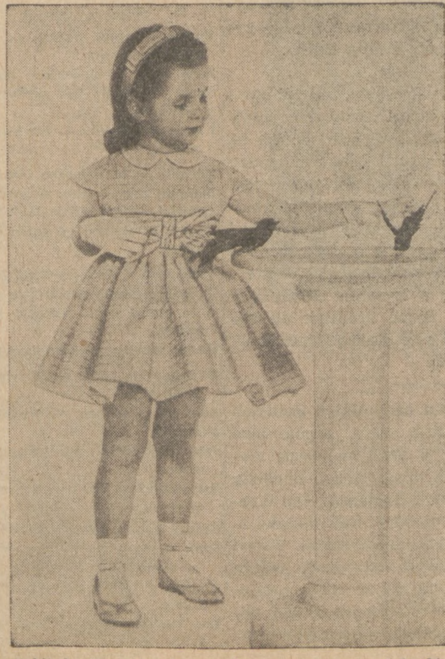
Sukienka dla małej dziewczynki z przezroczystego jedwabiu.

Samouczek "JAK WRÓŻYĆ Z KART" Nie należy jednocześnie uchylać faktu, że niejedna wróżba może się całkowicie sprawdzić, ostrzec przed jakimś błędem, lub niekorzystnym wydarzeniem, albo dodać otuchy i odwagi w niejednym krytycznym momencie w życiu. Dziękuję to "Jak wróżyc z kart", zawiera 96 stronice czytelnego druku, wraz z rycinami poszczególnych kart i tabelkami ich rozkładu do wróżenia. Książka ta kosztuje tylko $1.00 + przesyłka Zamówienia wraz z należnością nadsyłać należy: DZIENNIK ZWIĄZKOWY 1201 MILWAUKEE AVE. Chicago 22, Illinois (C.O.D. nie wysyłamy)