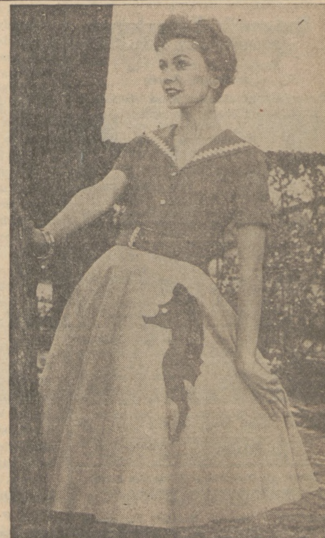
Wygodna, ładna i praktyczna sukienka pralna z bawełny na sezon letni

Smaczne kanapki na skromne przyjęcia można przyrządzić z grzanek (toast) masła i sera. Po posmarowaniu grzanek masłem nałożyć ser i wstawić do pieca na tak długo, aż ser rozpuści się. Podać na gorąco.