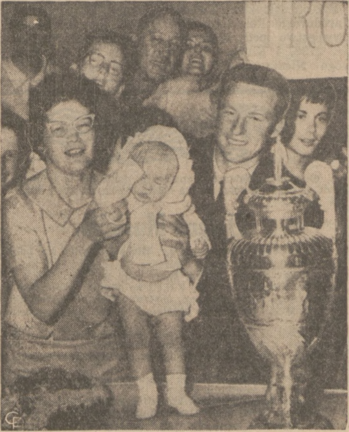
WELCOME HOME, CHAMPI—Deane Beman receives a hero's welcome on his arrival in Washington after winning the British amateur golf championship...