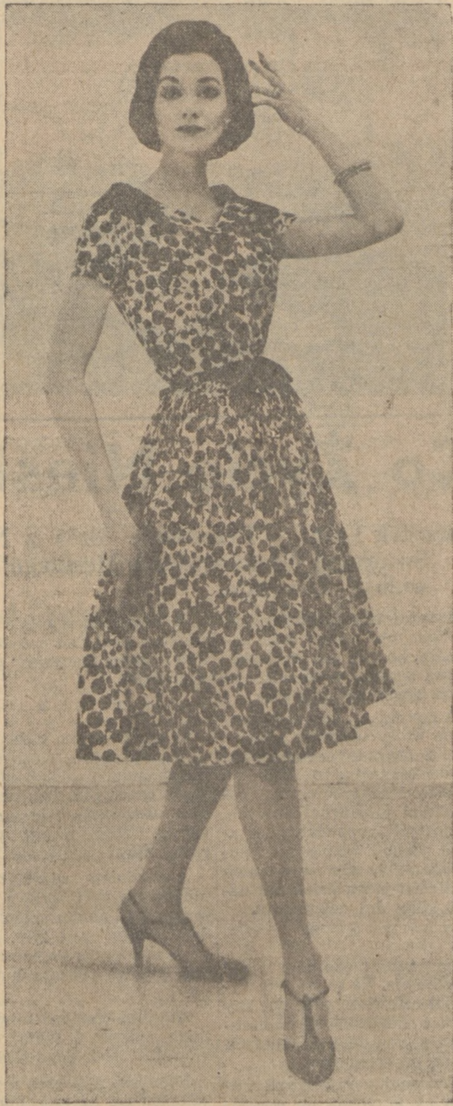
Suknia letnia z szyfonu w deseń.

Kobiety mamy w Kongresie od r. 1916 i ich liczba zarówno w Kongresie jak i w legislaturach stanowych i municypalnych wolno ale pewnie wzrasta. Kobiety znajdują się na wysokich stanowiskach w wojsku, w przemyśle i w zawodach wyzwolonych. Te i inne wskazania o postępkach kobiet w szkolnictwie, pracy zawodowej i życiu politycznym dowodzą, że barierą na drodze kobiety powoli ustępują. — (American Council).