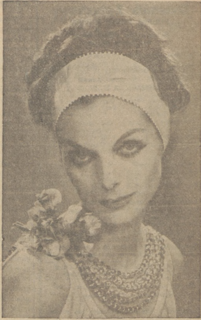
Najlepszym przykładem powtarzania się mody, to styl wyższy opaski na włosy, który to styl przed trzydziestu laty cieszył się wielkim wzięciem u modynych pań.

Aksamit odświeża się pociągając szmatką zmoconą w jakimkolwiek chemie z nym preparacie do czyszczenia w jednym kierunku, później zaś zawieszając się materiał na d para.